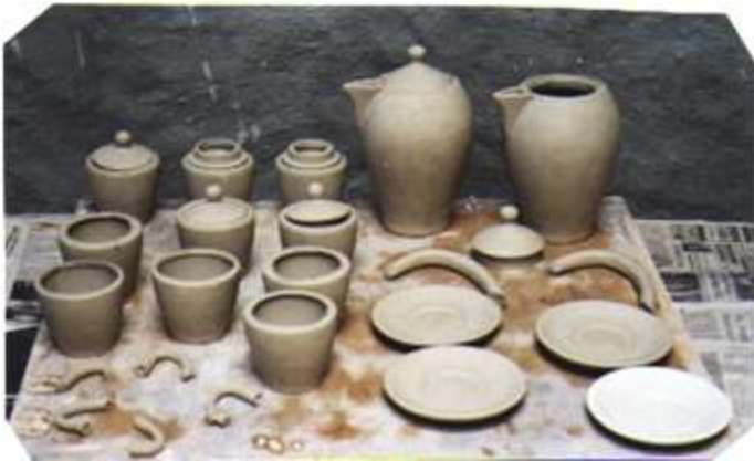
Prototipos desarrollados en crudo