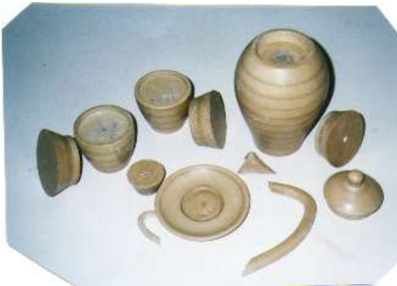
Matrices de madera utilizadas