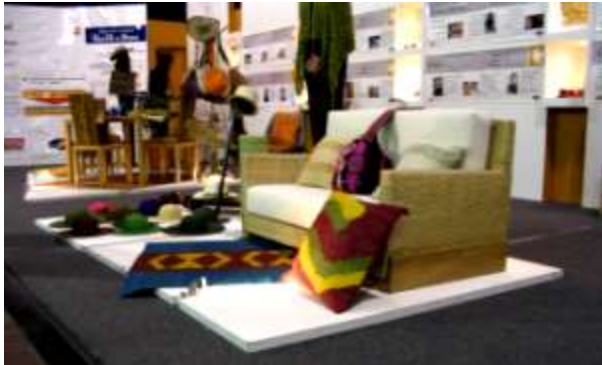
Stand de Cadena Productivas Expoartesanías 2004