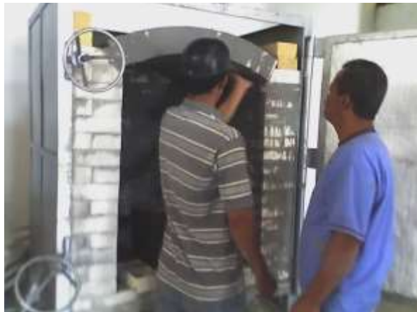
Proceso de construcción del Horno a gas en Pitalito