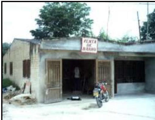
Sede provisional de la asociación de Artesanos Proveedores de Arcilla del Sur del Huila PROARSUR