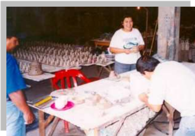
Talleres de creatividad desarrollados con artesanales atendidos en el Programa