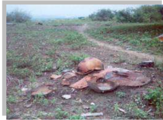
Horno antiguo suelana

Los hornos antiguos de leña o suelana que registraban pérdidas superiores al 50% en la quema de bizcocho, se han sustituido por hornos a gas, más eficientes y que generan menores impactos ambientales.