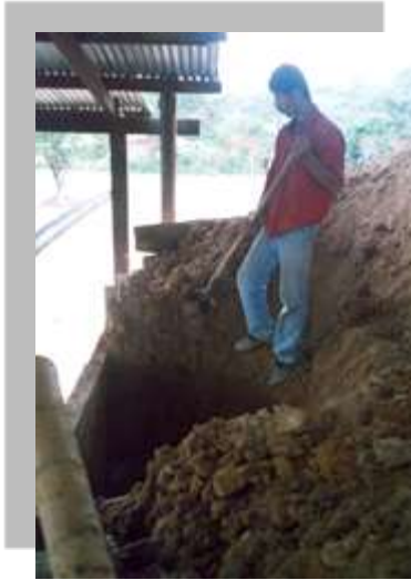
Actividades de acopio de arcillas