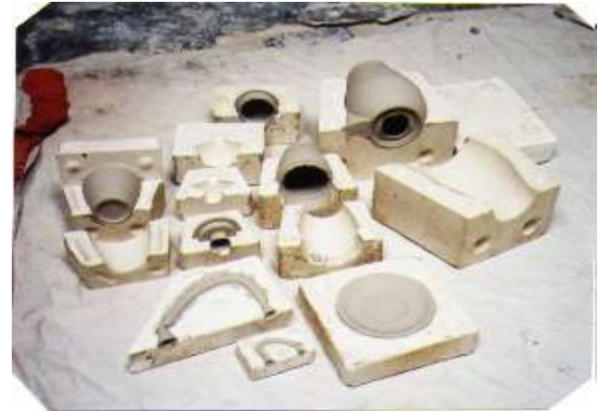
Moldes en yeso y piezas en crudo