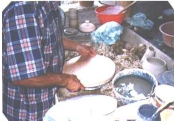
Asesoría para el uso adecuado de tablas intercambiables