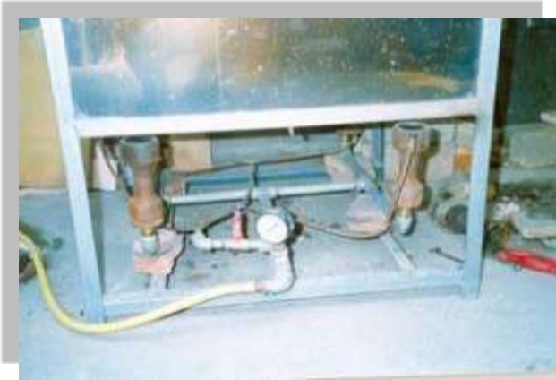
Instalación a gas Nueva