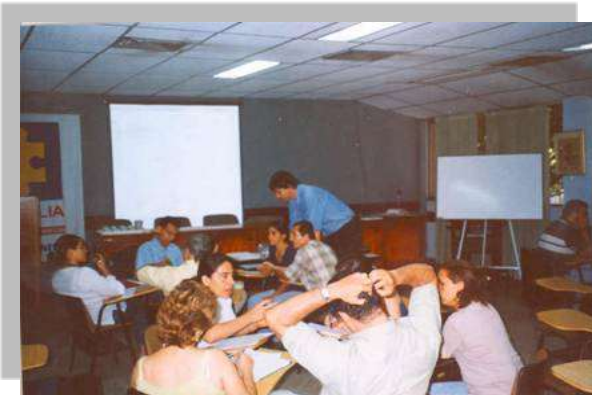
Sensibilización para firma de acuerdo - Neiva