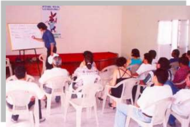
Capacitaciones en Gestión empresarial en las localidades atendidas