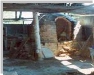
Horno antiguo abovedado