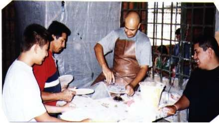
Asesorías en los talleres artesanales atendidos en el Programa