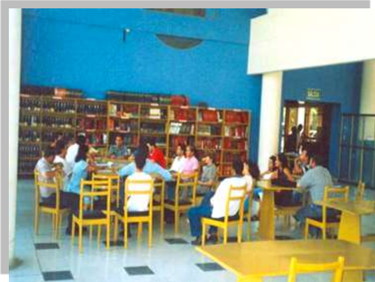
Talleres de capacitación en temas de comercialización