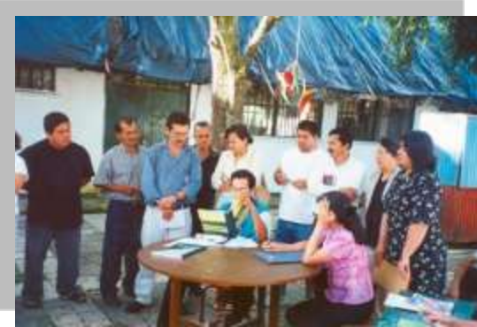
Mesa de concertación - Pitalito