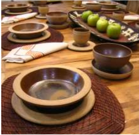
Línea de mesa desarrollada y exhibida