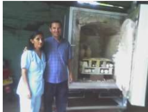
Horno a gas con columnas y refractarias cerámicas