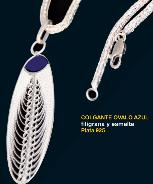
COLGANTE OVALO AZUL filigrana y esmalte Plata 925