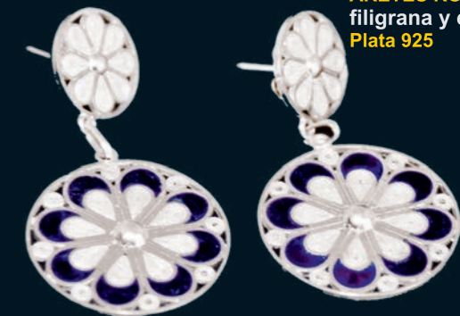
ARETES ROSETON filigrana y esmalte Plata 925