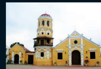
iglesia santa bárbara