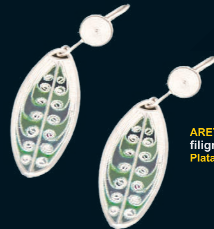
ARETES OVALO VERDE filigrana y esmalte Plata 925