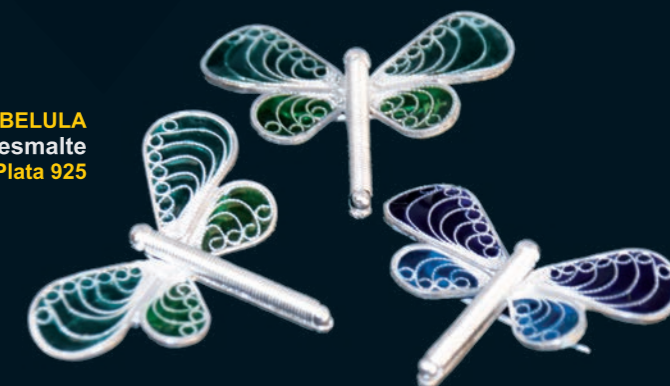
PRENDEDOR LIBELULA filigrana y esmalte Plata 925