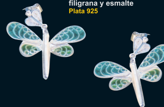
ARETES LIBELULA filigrana y esmalte Plata 925