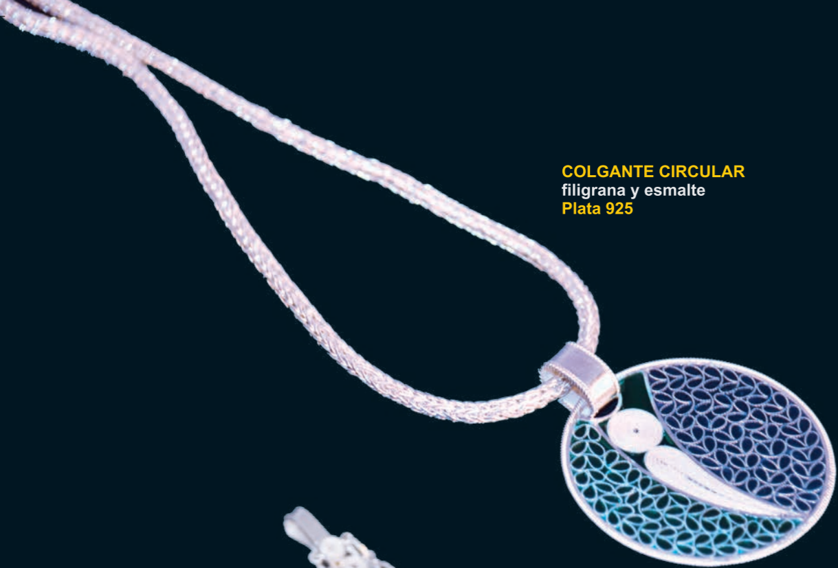
COLGANTE CIRCULAR filigrana y esmalte Plata 925