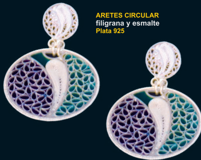
ARETES CIRCULAR filigrana y esmalte Plata 925