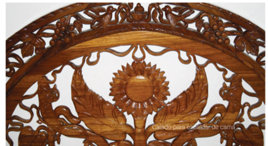
Calado para espalda de cama