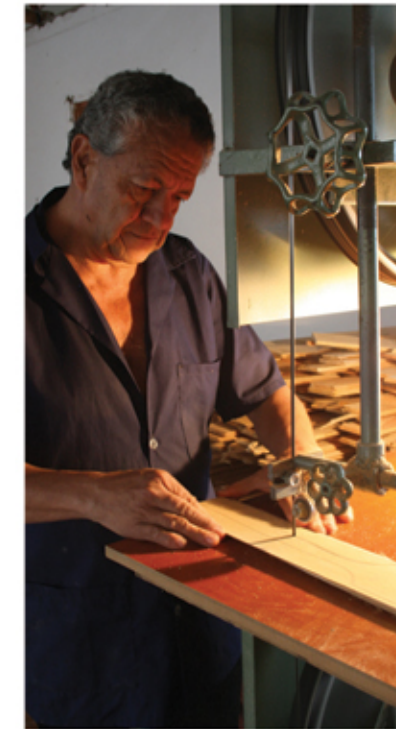
Artesano trabajando la madera

En el Eje Cafetero abundan los cultivos de guadua, una planta renovable que los artesanos aprovechan para convertir en floreros, lámparas, licoreras, cofres y bomboneras. Así mismo, distintas clases de madera, además de utilizarse en construcción y muebles, también se requiere para la elaboración de pequeños objetos como llaveros y utensilios de cocina.