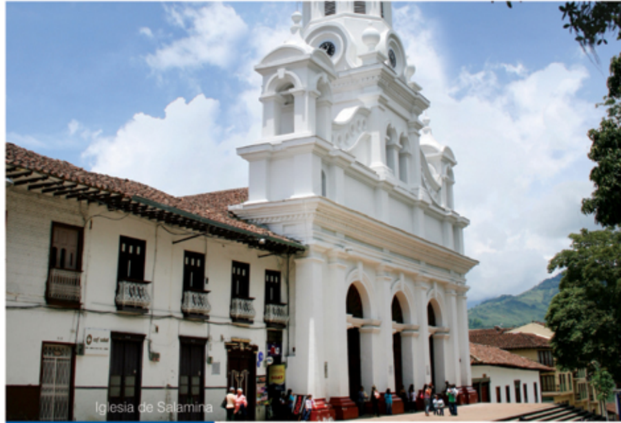
Iglesia de Salamina