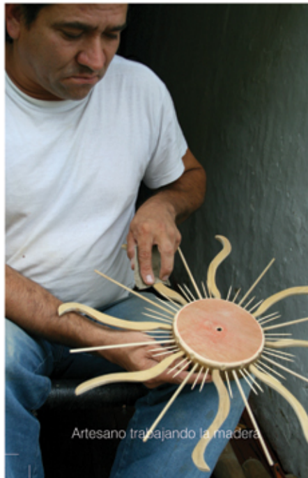
Artesano trabajando la madera

“Los saberes del ebanista que es leyenda se plasman hoy en la puerta, la venta y el balcón. El consagrado tallador moderno no quiere dejar ningún mal detalle suelto, sabe que es heredero de un saber hecho arte y tradición”.