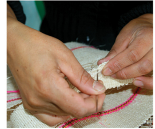
Tejido en fique

Aprecie los extensos cultivos de la planta que se encuentran antes de llegar a Salamina. Allí se lleva a cabo todo el proceso, desde el corte de la penca y el desfibrado, hasta el tejido de bolsos, carteras, cinturones, individuales y manteles, objetos que se podrán adquirir en las tiendas artesanales.