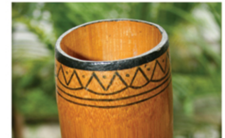
Artesanía en guadua