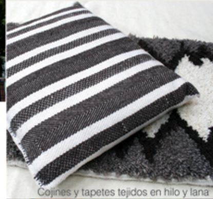
Cojines y tapetes tejidos en hilo y lana