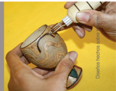
Diseños hechos sobre totumo

Estas materias primas son transformadas en vasijas, floreros, fruteros, copas, licoreras y llaveros. La decoración de los objetos es hecha con pinturas y labrados en técnica de pirograbado.