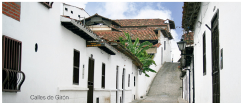
Calles de Girón

Girón fue fundada en 1631 y desde aquella época se ha mantenido el interés por la conservación de sus tradiciones, su arquitectura y su historia. Se mantienen en pie grandes casonas coloniales, calles empedradas, faroles, paredes muy blancas, puentes de calicanto y una fervorosa identidad religiosa, manifiesta en hermosas iglesias. San Juan de Girón es conocida como la Ciudad Blanca o la Villa de los Caballeros, en la que muchos años el cultivo del tabaco ha sido la principal actividad e inspiración artesanal.