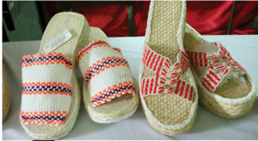
Sandalias en fique