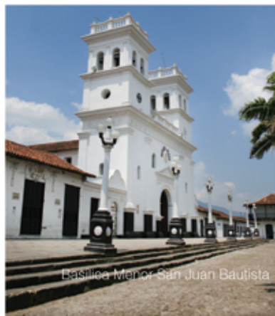
Basilica Menor San Juan Bautista

La tradición tabacalera es marca de este pueblo santandereano, sin embargo, por la ley antitabaco y las crecientes campañas prohibitorias, la fuerza del sembrador y la pericia del artesano se han volcado hacia otras formas y materias. En barro, madera, cuero, fique y semillas, las imágenes patrimoniales gironesas, con casi cuatro siglos de existencia, perduran en la mirada y en la memoria. Aunque igual, la hoja de marras, si no envuelta en exclusivos puros, sigue siendo usada a manera de lienzo, fibra u ornamento.