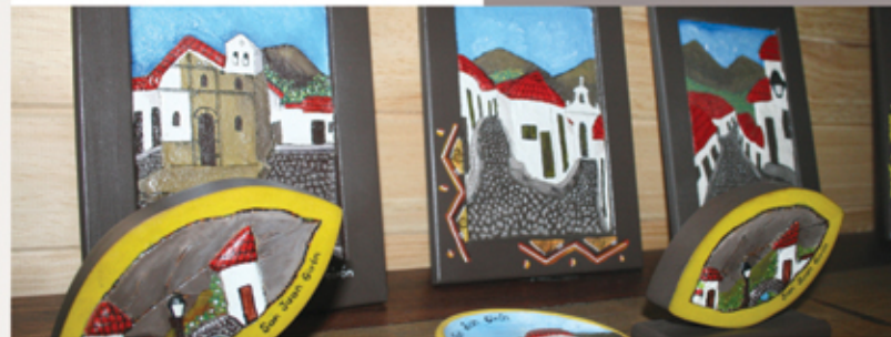
Pinturas de fachadas de Girón

"Sea con arena, en hojas de tabaco, en fique o en arcilla. Las calles de Girón son indelebles en la memoria del artesano, que las recrean con llamativa fidelidad."