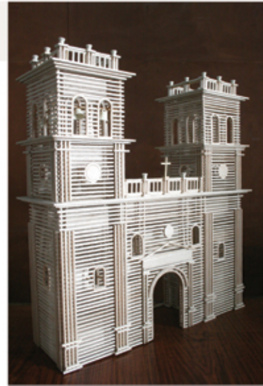
Fachada hecha en madera

Las imágenes más representativas de Girón son motivo permanente de los artífices reflejado en cuadros, llaveros, portallaveros y varias clases y formas de utensilios y elementos decorativos.