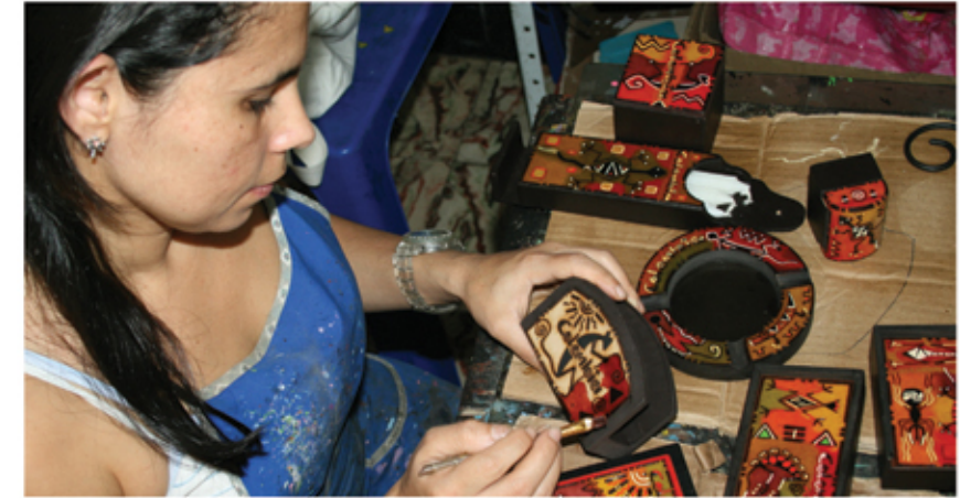
Artesanías en madera