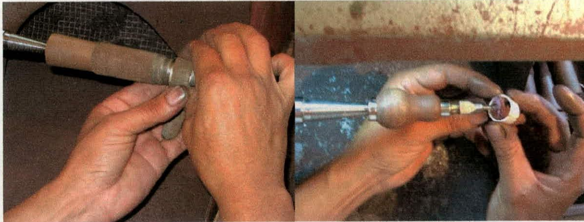
Pulimento con dedo de felpa prensado.