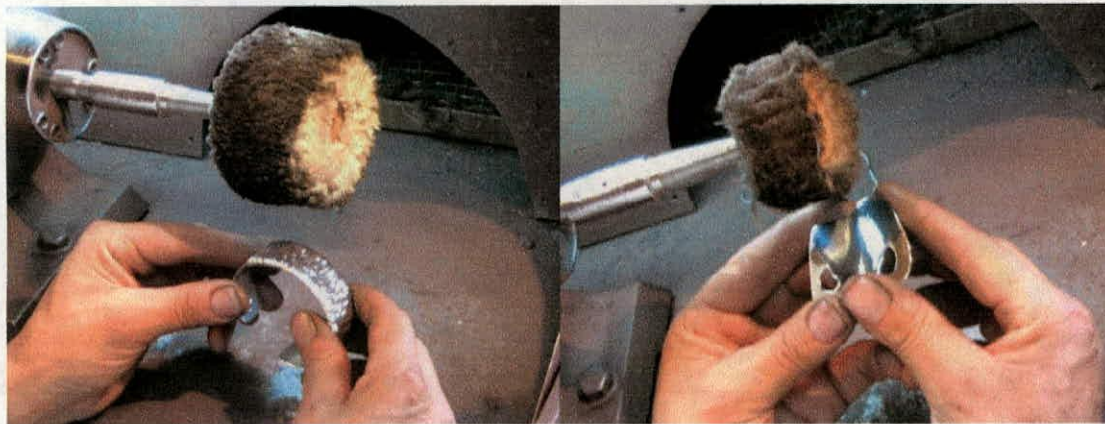
Brillo con felpa de becerro.