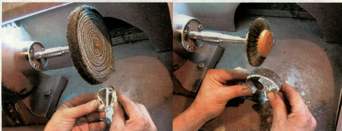
Pulimento con felpa dura tela ordinaria.

Herramienta para utilizar en el proceso de pulimento.