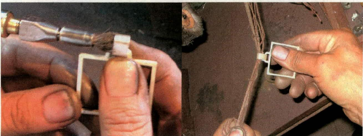
Pulimento con brocha