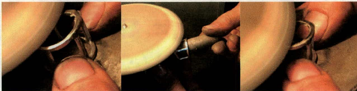
Primer paso del lapin