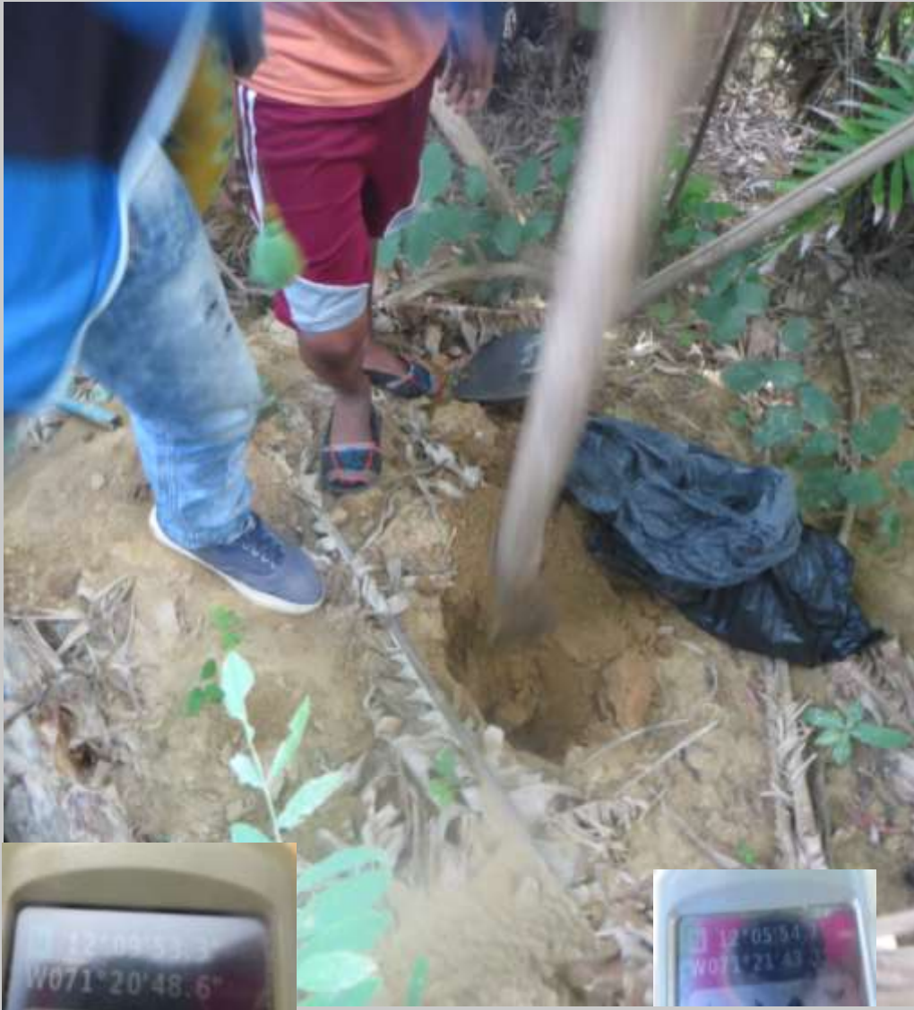
Foto 1. Toma de Muestra de suelos Predio 4