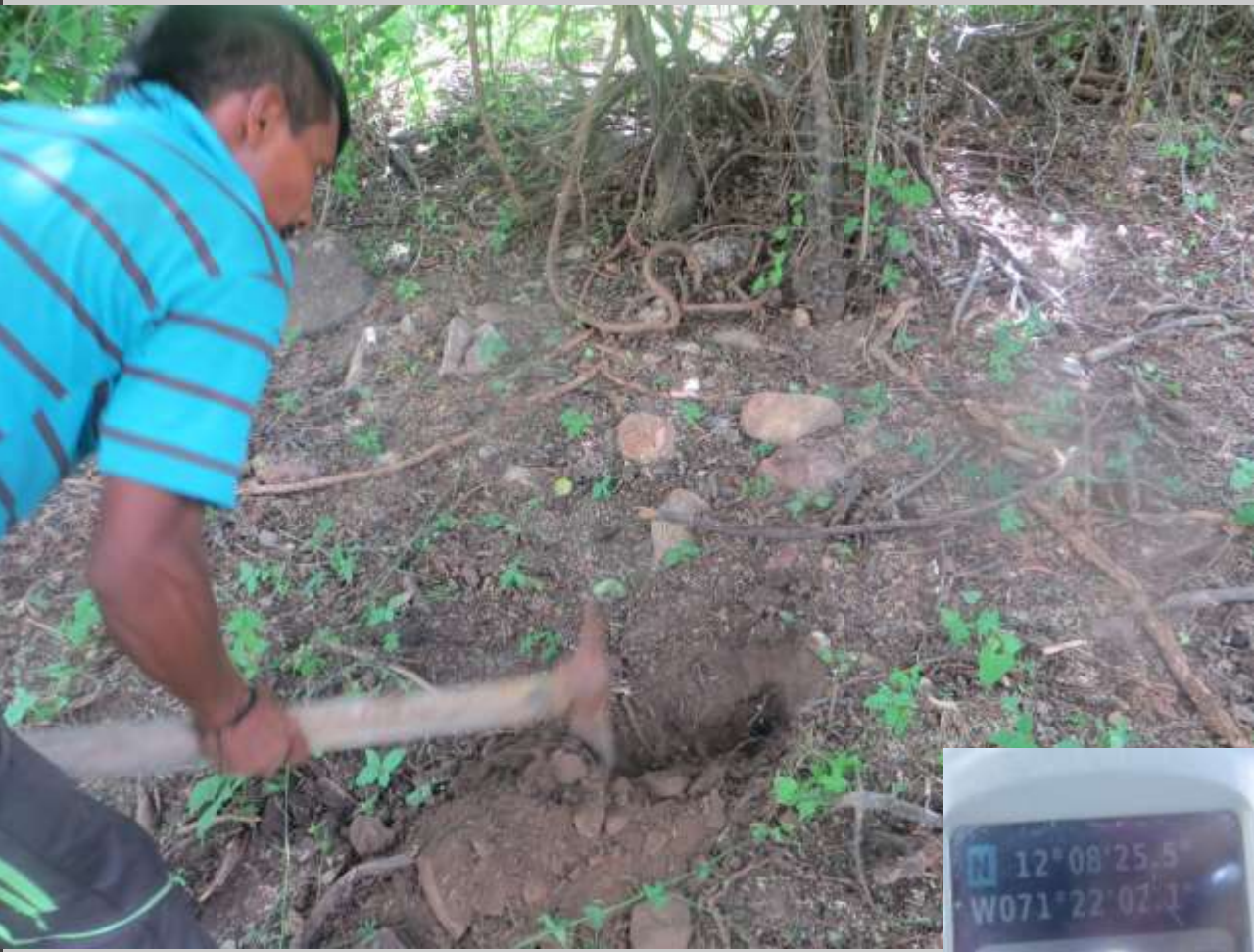
Foto 1. Toma de Muestra de suelos Parcela 1 Baja . C Isijolu