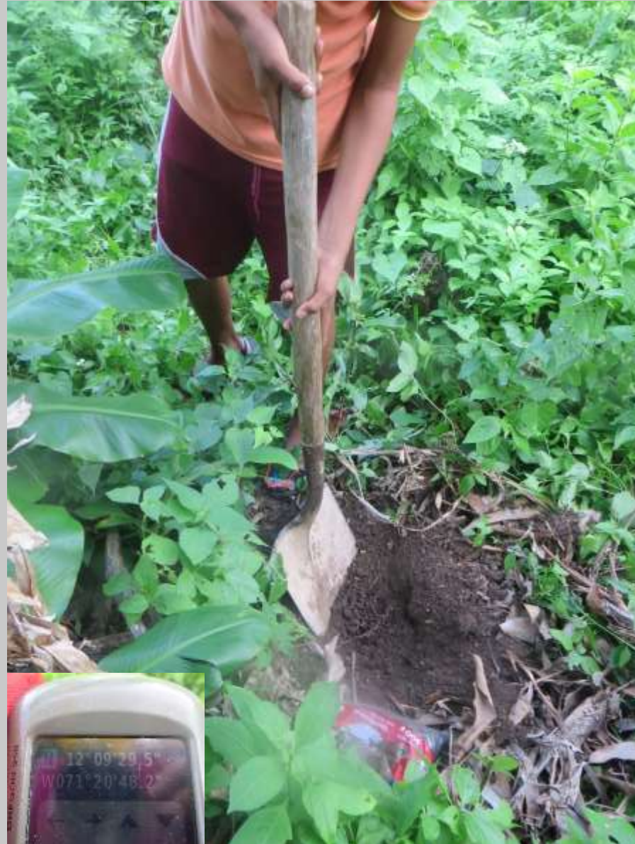
Foto 1. Toma de Muestra de suelos Predio cultivado 3