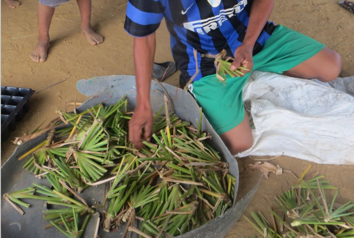
Selección de yemas