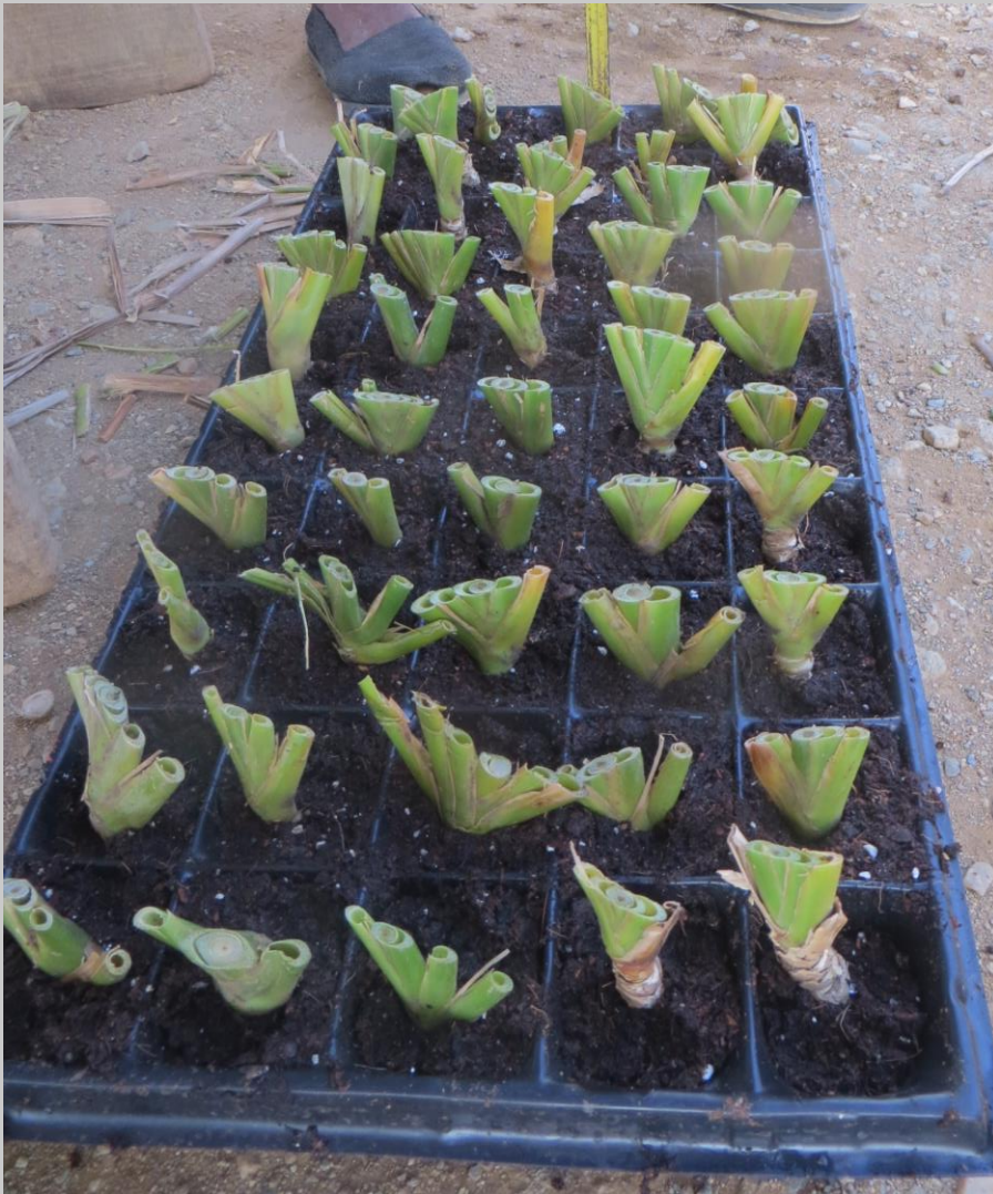
Siembra de yemas en bandejas