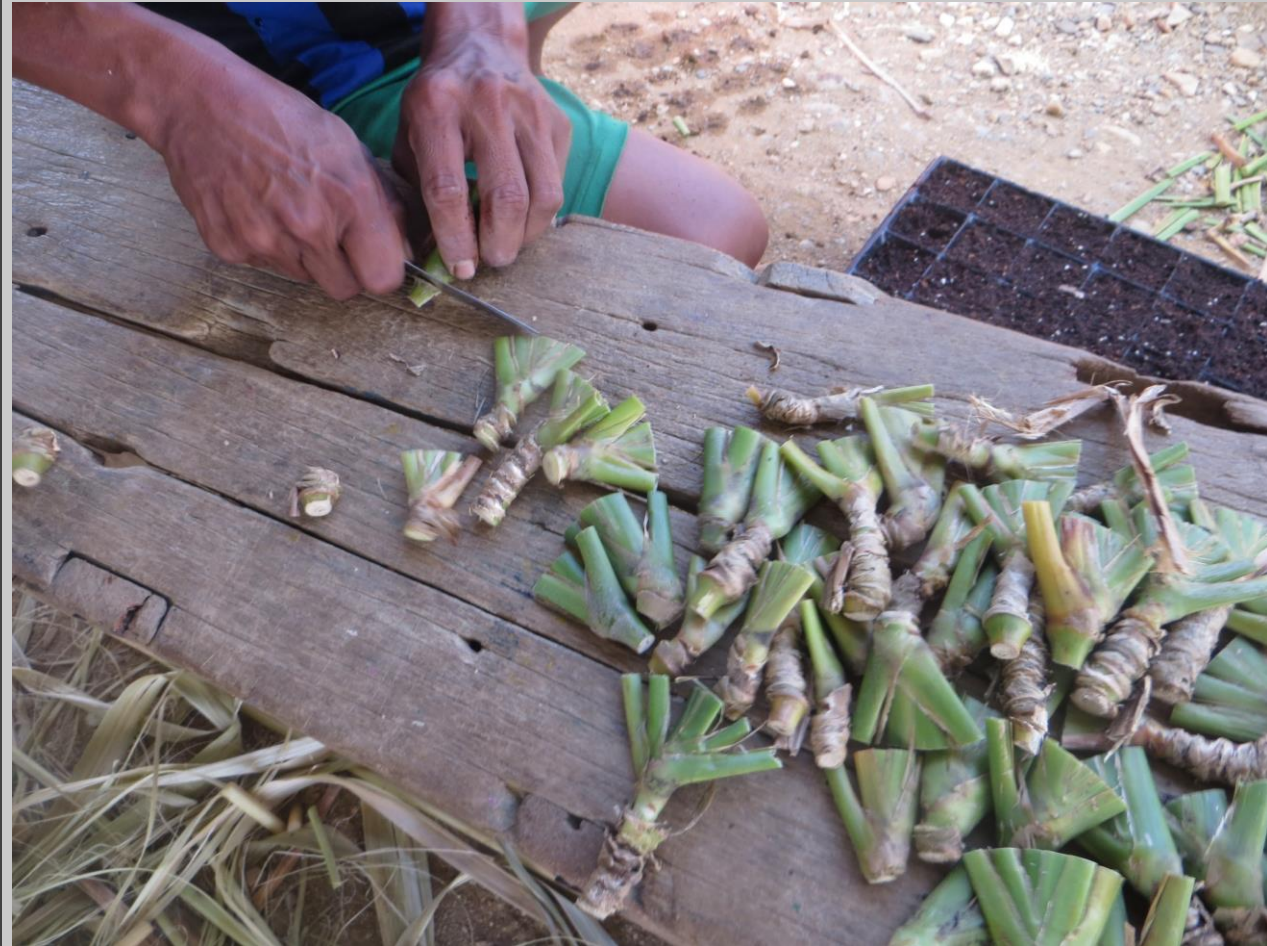
Selección de yemas