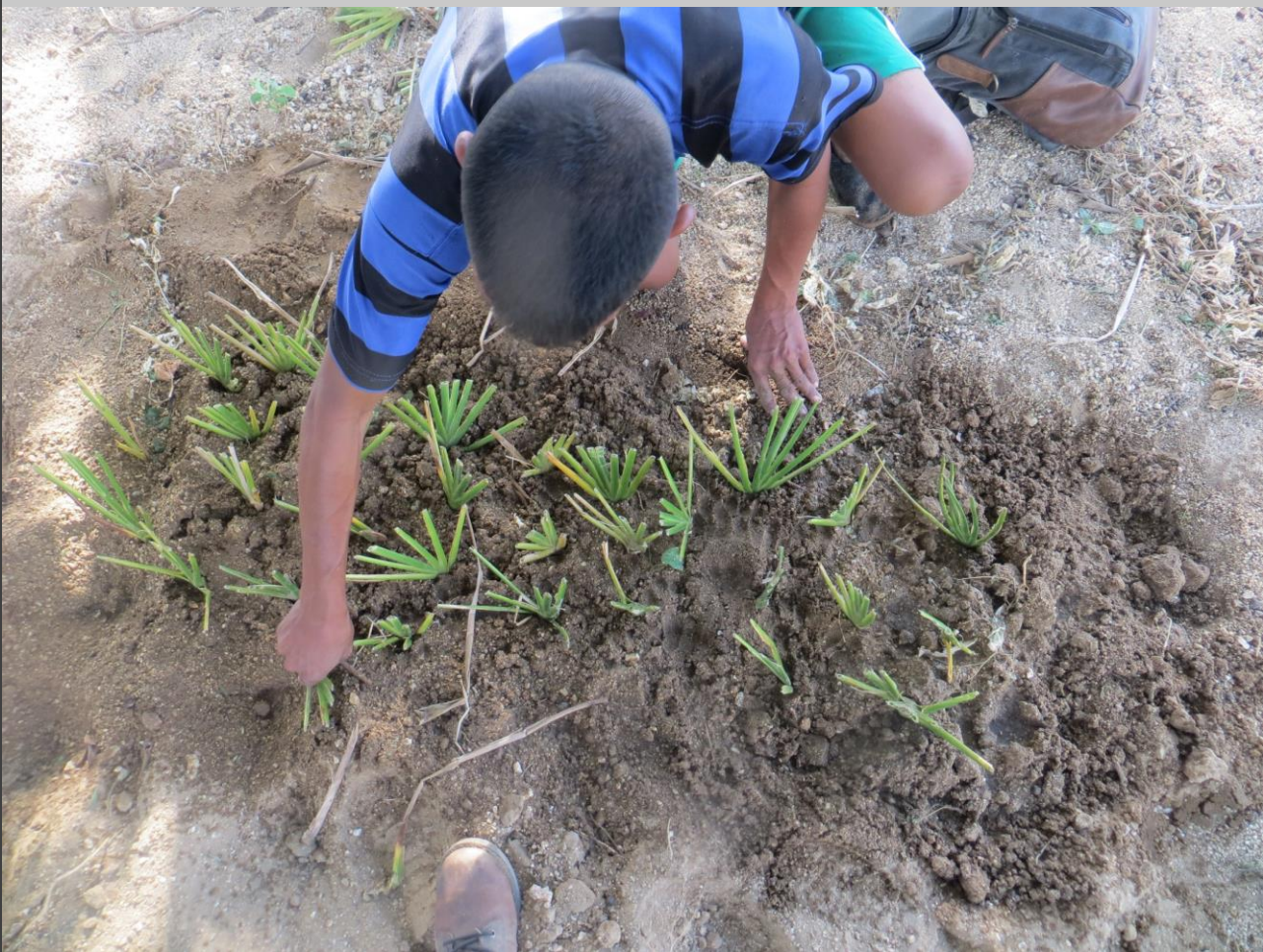
Siembra directa de yemas en terreno