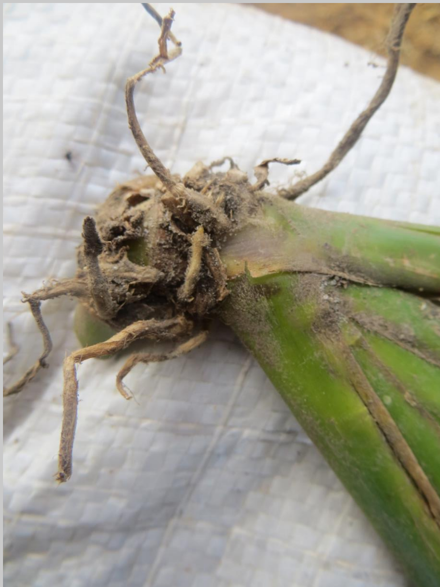
Selección de yemas