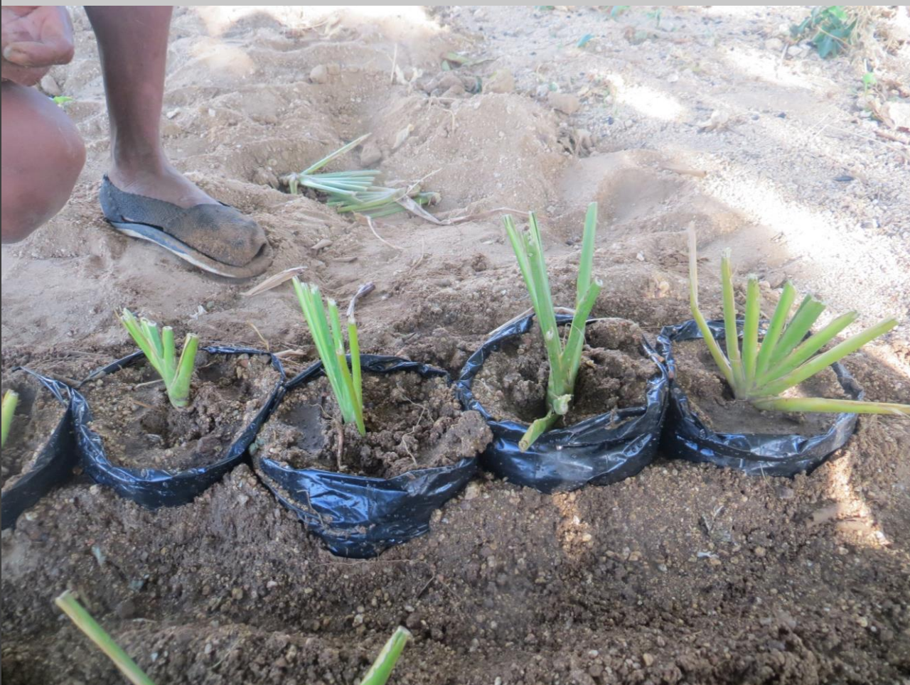
Siembra de yemas en bolsas