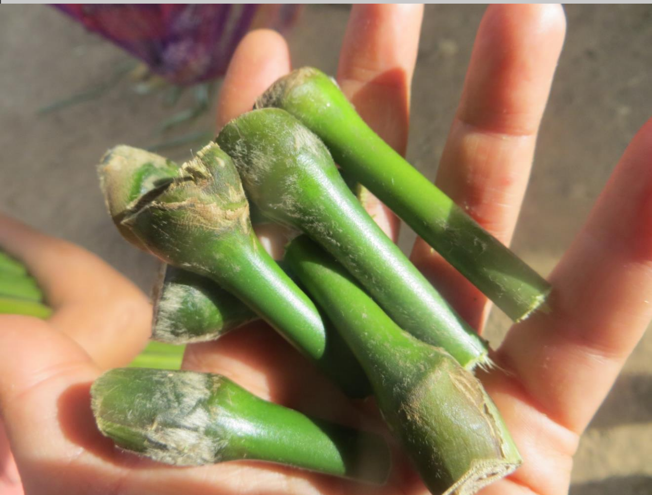
Selección de yemas