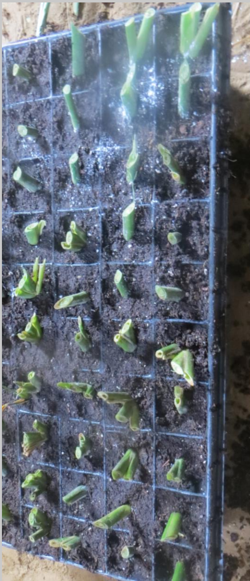
Aplicación de enraizador