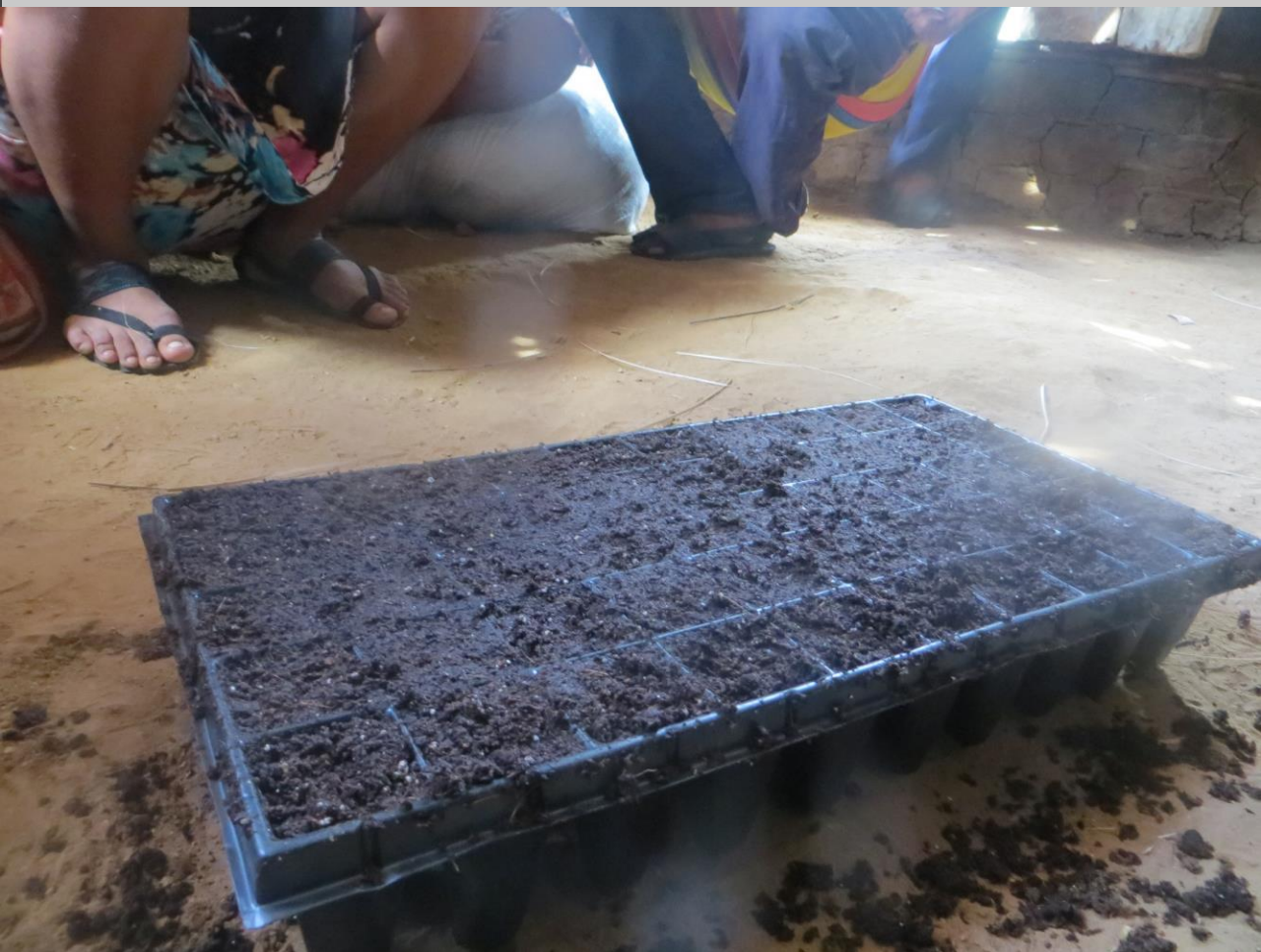
Llenado de bandejas con turba