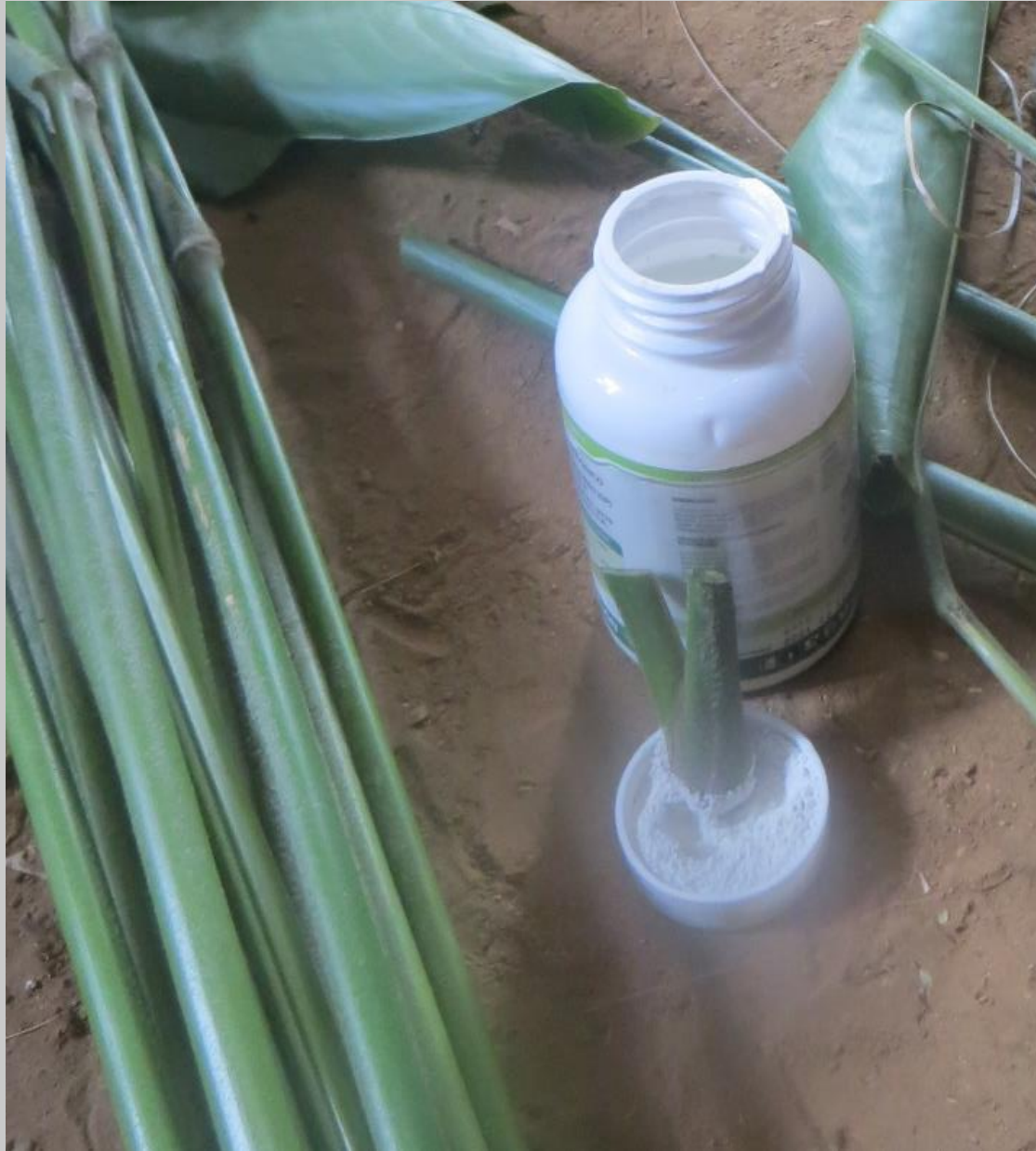
Aplicación de enraizador