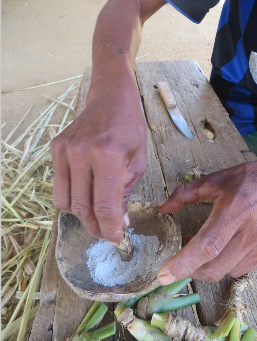
Aplicación de enraizador