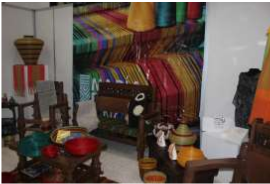
Tomada por : Corina Fajardo Lugar: Duitama Fecha : 08/2015 Artesanías de Colombia

Descripción: Presentación del Laboratorio de Innovación y Diseño de Boyacá en el lanzamiento de la marca Territorial “SOY BOYACA”.