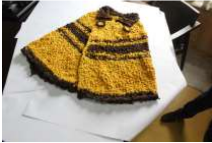
Lugar: Tunja Fecha : 08/2015 Artesanías de Colombia Descripción: Evaluación de Producto