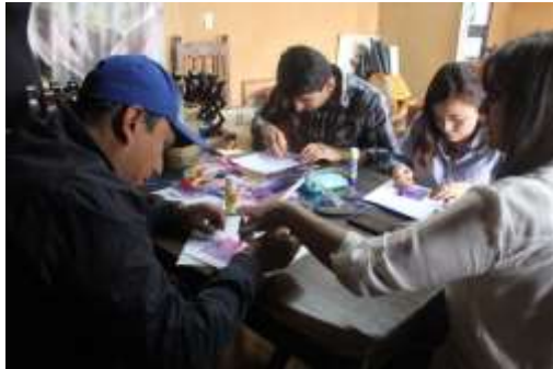
Lugar: Tunja Fecha : 10/2015 Artesanías de Colombia Descripción: Jornada de trabajo