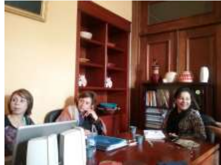
Lugar: Tunja Fecha : 09/2015 Artesanías de Colombia Descripción: Reunión Corporación de Caldas

Se realizaron dos jornadas de trabajo con los diseñadores del programa de Artesanías de Boyacá donde se ha trabajado en los diseños a realizar en Expoartesanías 2015.