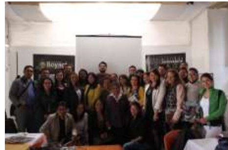
Lugar: Tunja Fecha : 12/2015 Artesanías de Colombia Descripción: III Consejo Regional para la actividad Artesanal del departamento de Boyacá