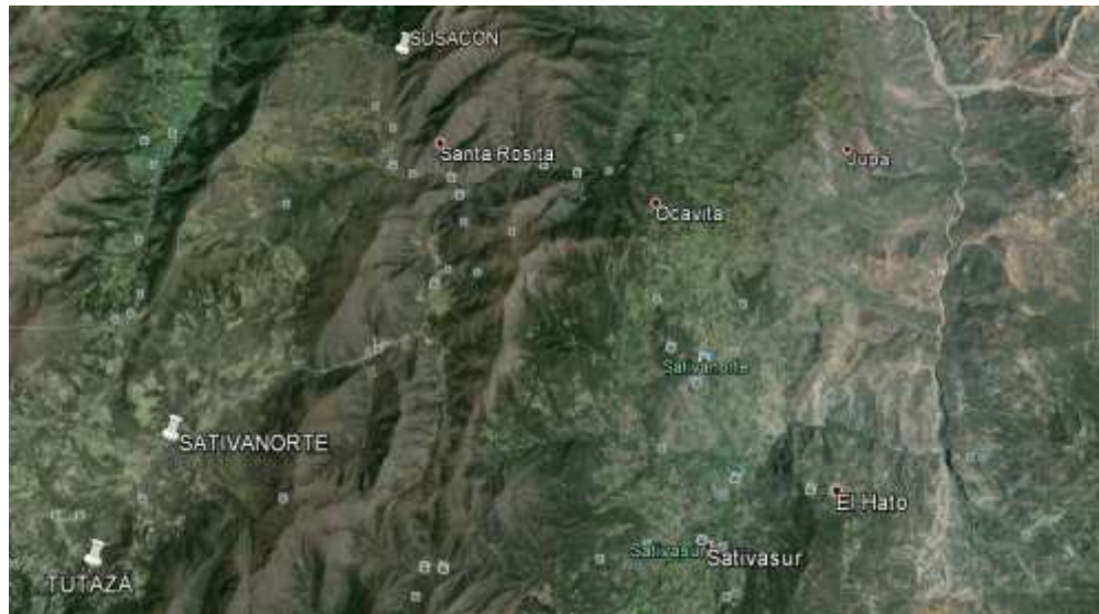
Imagen Satelital de la Ubicación de los Beneficiarios. Ing. Leonor Celis.