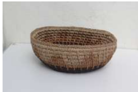
Lugar :Tunja Fecha : 10/2015 Artesanías de Colombia Descripción: Asesoría Puntual