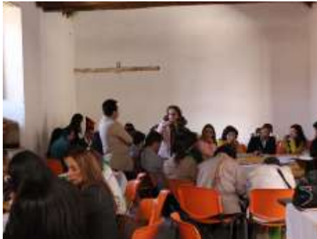
Lugar: Tunja Fecha : 12/2015 Artesanías de Colombia Descripción: III Consejo Regional para la actividad Artesanal del departamento de Boyacá