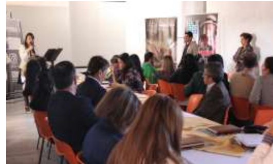
Lugar: Tunja Fecha : 12/2015 Artesanías de Colombia Descripción: III Consejo Regional para la actividad Artesanal del departamento de Boyacá