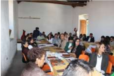
Lugar: Tunja Fecha : 12/2015 Artesanías de Colombia Descripción: III Consejo Regional para la actividad Artesanal del departamento de Boyacá