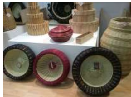
Lugar: Expoartesanías 2015 Fecha : 12/2015 Artesanías de Colombia Descripción: Montaje stand Institucional Corpochivor