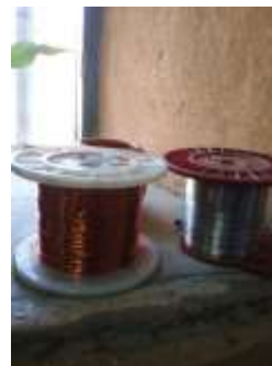
Lugar: Tunja Fecha : 08/2015 Artesanías de Colombia