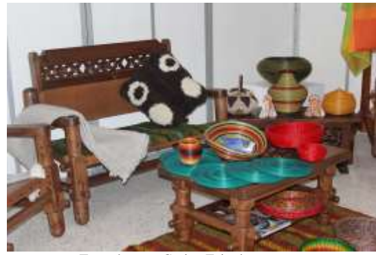
Lugar: Duitama Fecha : 08/2015 Artesanías de Colombia

Descripción: Presentación del Laboratorio de Innovación y Diseño de Boyacá en el lanzamiento de la marca Territorial “SOY BOYACA”.