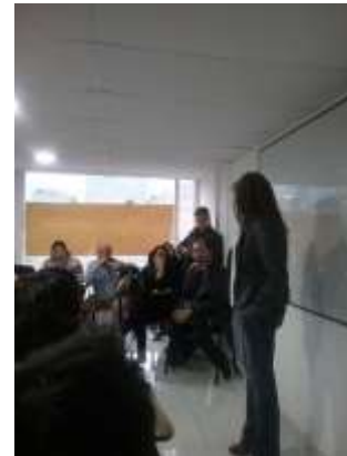
Lugar: Bogotá Fecha : 09/2015 Artesanías de Colombia Descripción: Jornada de trabajo de Enlaces

Los diseñadores líderes serán los encargados de hacer una primera curaduría de los productos, luego estos se le presentarán a la Gerente para dar la aprobación de la producción. La estrategia principal es la creación de microambientes en los cuales los oficios artesanales van a resaltar sus técnicas.