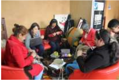
Lugar: Tunja Fecha : 10/2015 Artesanías de Colombia Descripción: Asesoría Puntual