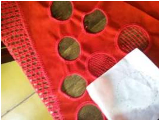
Lugar: Tunja Fecha : 09/2015 Artesanías de Colombia Descripción: Asesoría Puntual. Avance propuesta de diseño.