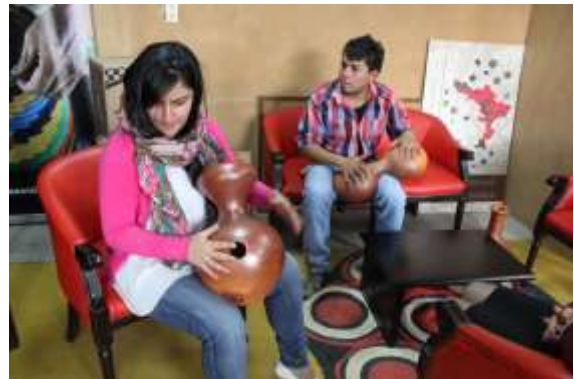
Lugar: Tunja Fecha : 08/2015 Artesanías de Colombia Descripción: Producto desarrollado para música a partir de cerámica.