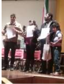
Lugar: Tunja Fecha : 09/2015 Artesanías de Colombia Descripción: III Biental Artesanal de Boyacá