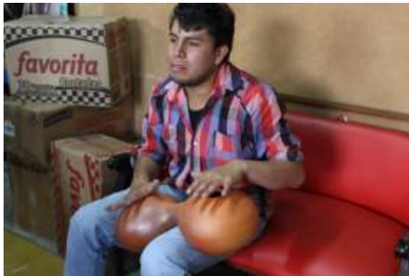
Lugar: Tunja Fecha : 08/2015 Artesanías de Colombia Descripción: Producto desarrollado por artesano para música.