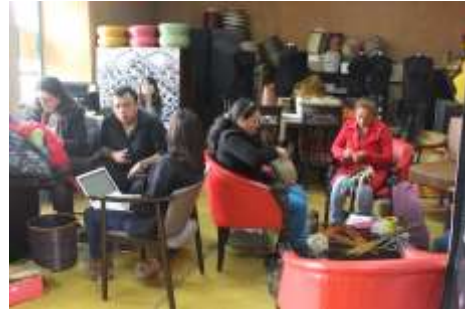
Lugar :Tunja Fecha : 10/2015 Artesanías de Colombia Descripción: Asesoría Puntual