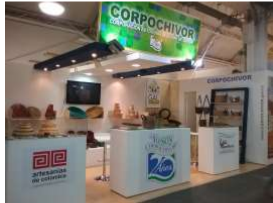
Lugar: Expoartesanías 2015 Fecha : 12/2015 Artesanías de Colombia Descripción: Montaje stand Institucional Corpochivor