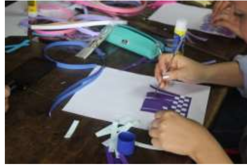
Lugar: Tunja Fecha : 10/2015 Artesanías de Colombia Descripción: Jornada de trabajo