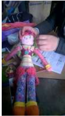
Lugar: Tunja Fecha : 08/2015 Artesanías de Colombia Descripción: Asesoría Puntual