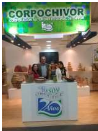
Lugar: Expoartesanías 2015 Fecha : 12/2015 Artesanías de Colombia Descripción: Montaje stand Institucional Corpochivor