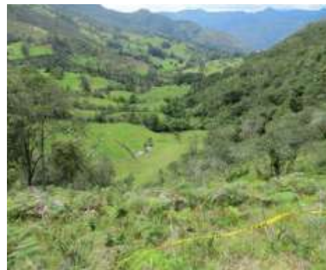
Vereda Uragón- Municipio Guacamayas