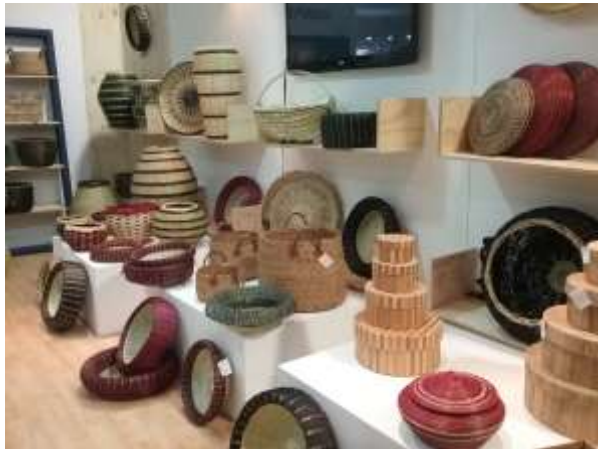
Lugar: Expoartesanías 2015 Fecha : 12/2015 Artesanías de Colombia Descripción: Montaje stand Institucional Corpochivor