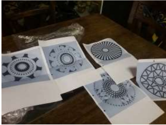
Lugar: Tunja Fecha : 08/2015 Artesanías de Colombia Descripción: Asesoría Puntual. Referente torteros Muiscas