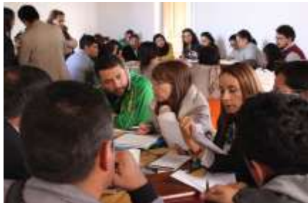
Lugar: Tunja Fecha : 12/2015 Artesanías de Colombia Descripción: III Consejo Regional para la actividad Artesanal del departamento de Boyacá