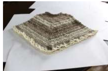
Tomada por : Rosnery Pineda Cubides Lugar: Tunja Fecha : 08/2015 Artesanías de Colombia Descripción: Evaluación de Producto