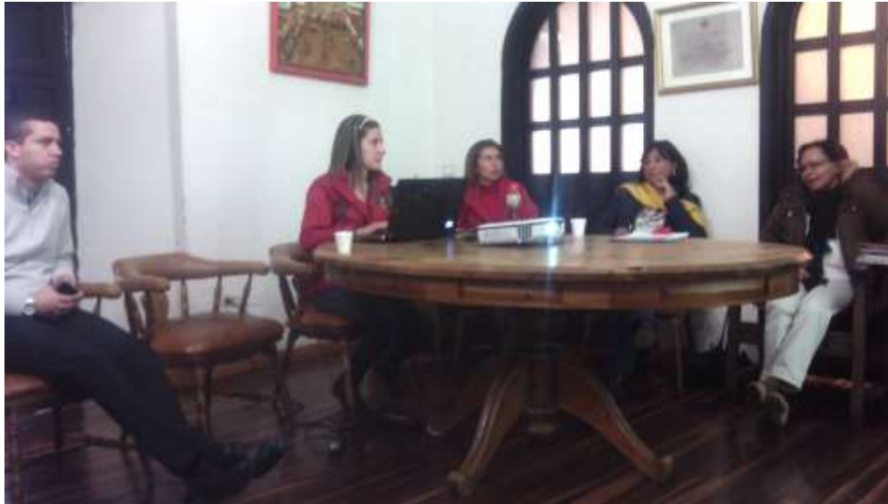
Comité de Turismo de Boyacá.