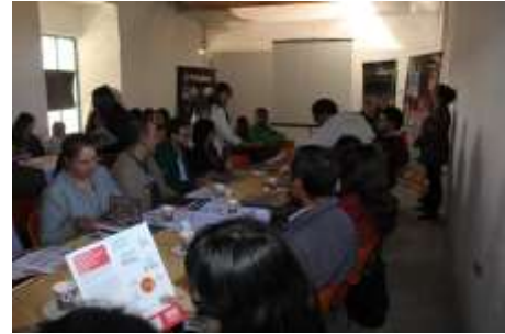
Lugar: Tunja Fecha : 12/2015 Artesanías de Colombia Descripción: III Consejo Regional para la actividad Artesanal del departamento de Boyacá