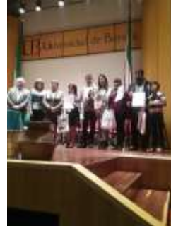
Lugar: Tunja Fecha : 09/2015 Artesanías de Colombia Descripción: III Biental Artesanal de Boyacá