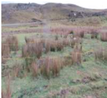
Vereda Téquita – Municipio Sativanorte (Boyacá)