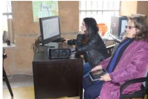
Lugar :Tunja Fecha : 10/2015 Artesanías de Colombia Descripción: Transferencia de conocimiento en Diseño