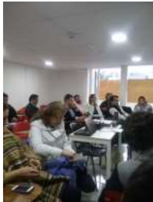
Tomada por : Rosnery Pineda Cubides Lugar: Bogotá Fecha : 09/2015 Artesanías de Colombia Descripción: Jornada de trabajo de Enlaces