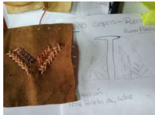
Lugar: Tunja Fecha : 09/2015 Artesanías de Colombia Descripción: Asesoría Puntual. Avance propuesta de diseño.

Se desarrolló una práctica de tinturación con los artesanos del municipio de Combita y el equipo de diseñadores industriales de la Gobernación de Boyacá con el fin de hacer transferencia de conocimiento.