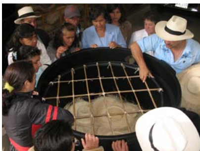
Lugar: Aguadas, bodega Comité de Cafeteros. Fecha : agosto de 2008 Descripción: asistencia técnica – mejoramiento tecnológico