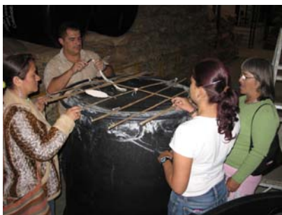
Lugar: Aguadas, bodega Comité de Cafeteros. Fecha : agosto de 2008 Descripción: asistencia técnica – mejoramiento tecnológico