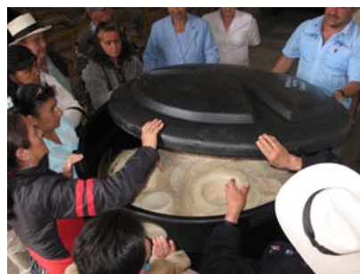
Lugar: Aguadas, bodega Comité de Cafeteros. Fecha : agosto de 2008 Descripción: asistencia técnica – mejoramiento tecnológico