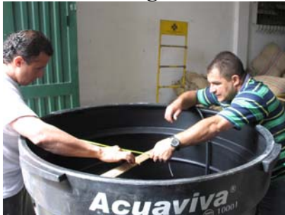
Lugar: Aguadas, bodega Comité de Cafeteros. Fecha : agosto de 2008 Descripción: asistencia técnica – mejoramiento tecnológico