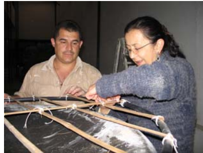
Lugar: Aguadas, bodega Comité de Cafeteros. Fecha : agosto de 2008 Descripción: asistencia técnica – mejoramiento tecnológico.