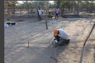
Plan de trabajo