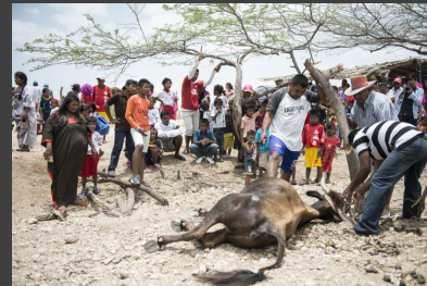
Coordinación de las acciones