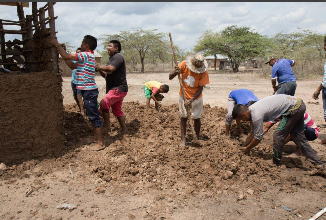
YANAMA – TRABAJO COLABORATIVO