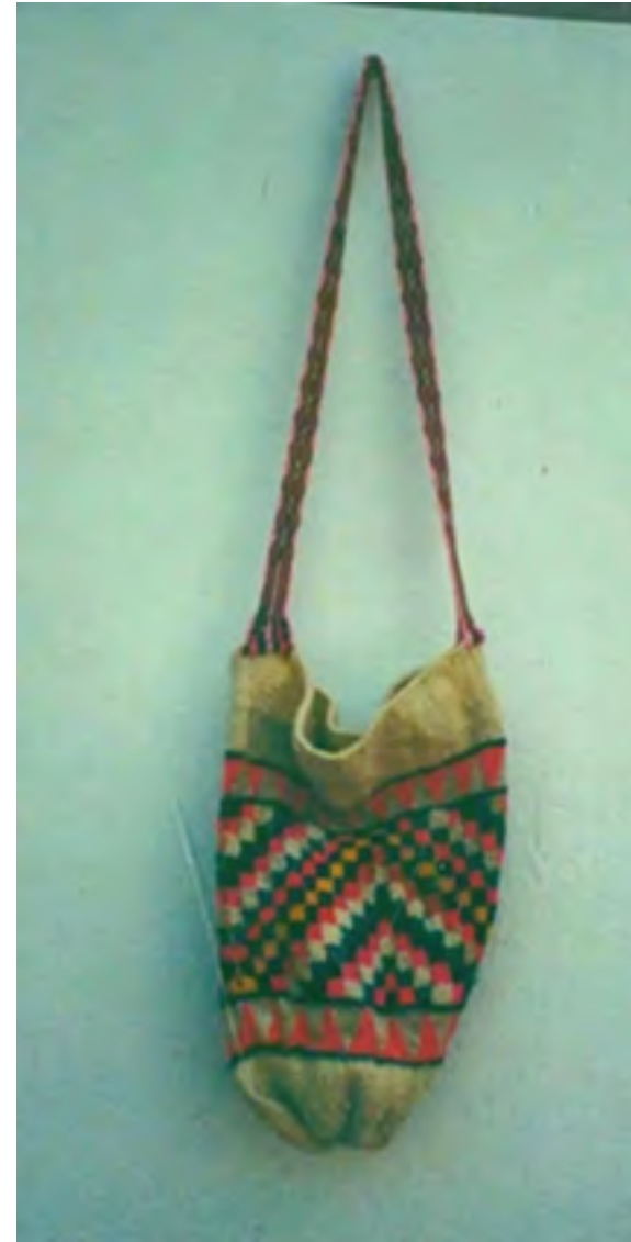
Tejidos con aguja de crochet SANTA ROSA - CAUCA Muestra de producto