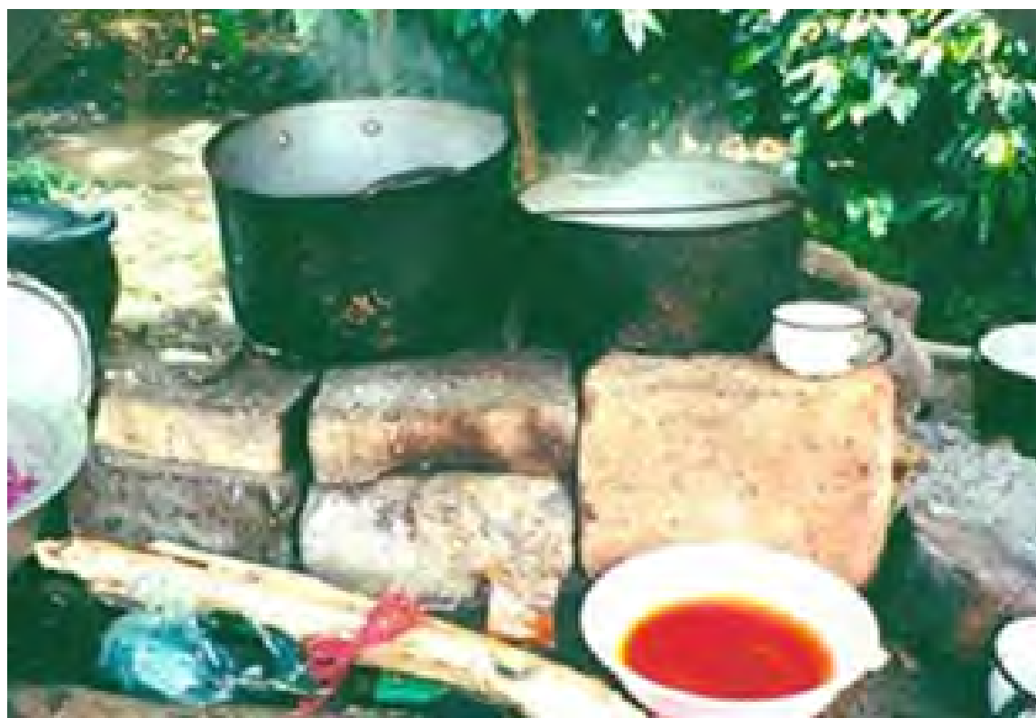
No 8 19,20,08,23 Tejidos con aguja de crochet V. CHISQUIO-CAUCA Ollas