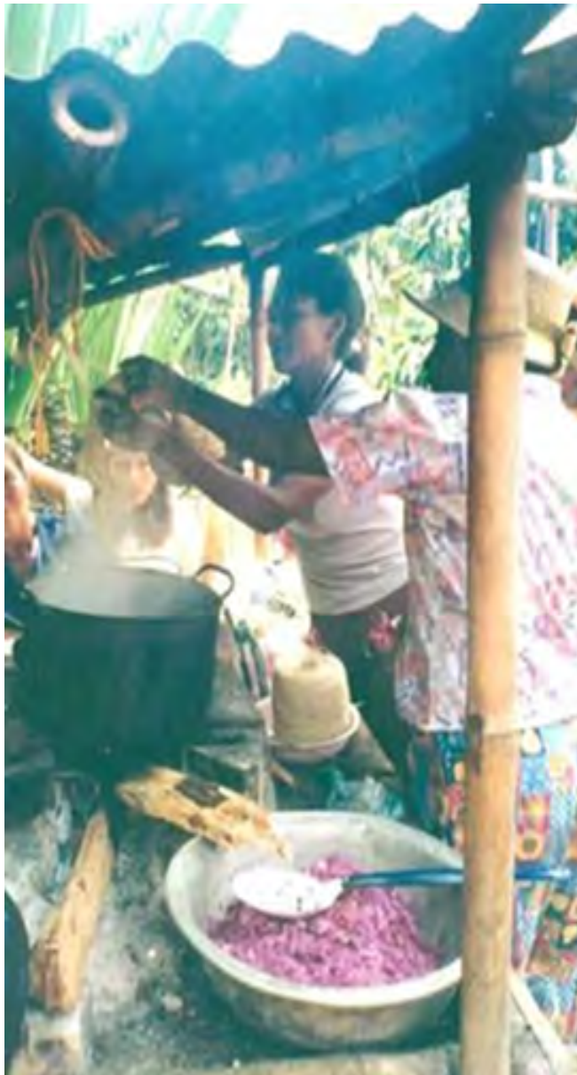
No 9 19,20,09,23 Tejidos con aguja de crochet V. CHISQUÍO-CAUCA Proceso de teñido