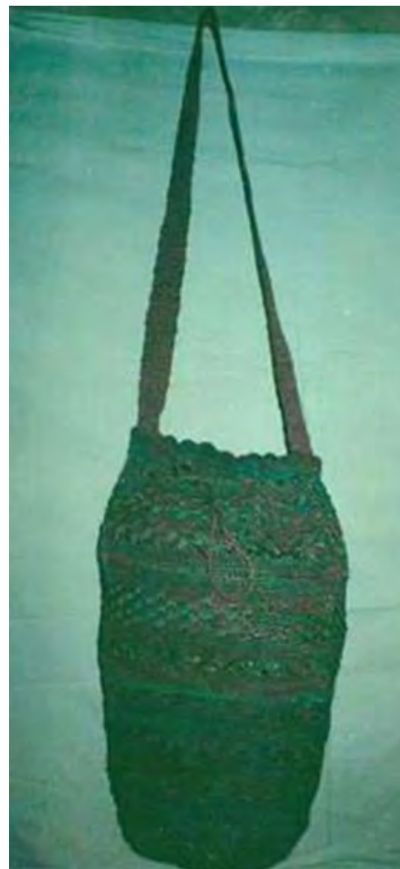
No 15 19,20,15,23 Tejidos con aguja de crochet V. CHISQUIÑO-CAUCA Mochila tradicional