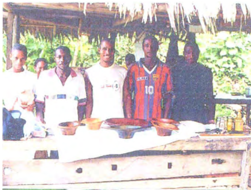
Artesanos Aguacatico - Chocó