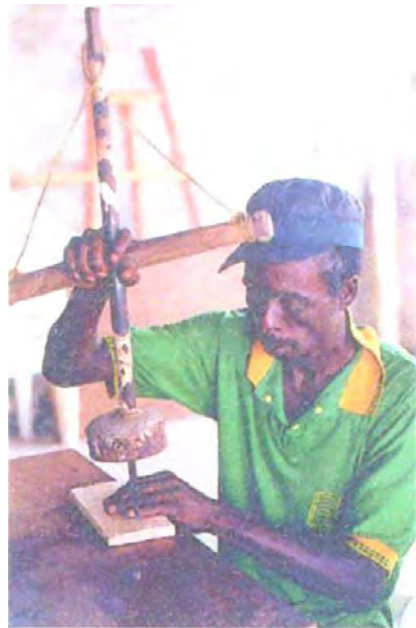
Taladro construido por el artesano