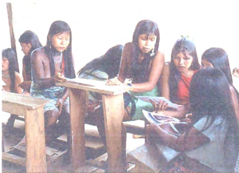
Comunidad indígena de Panguí