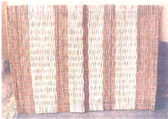
Ajustes en la costura y remates