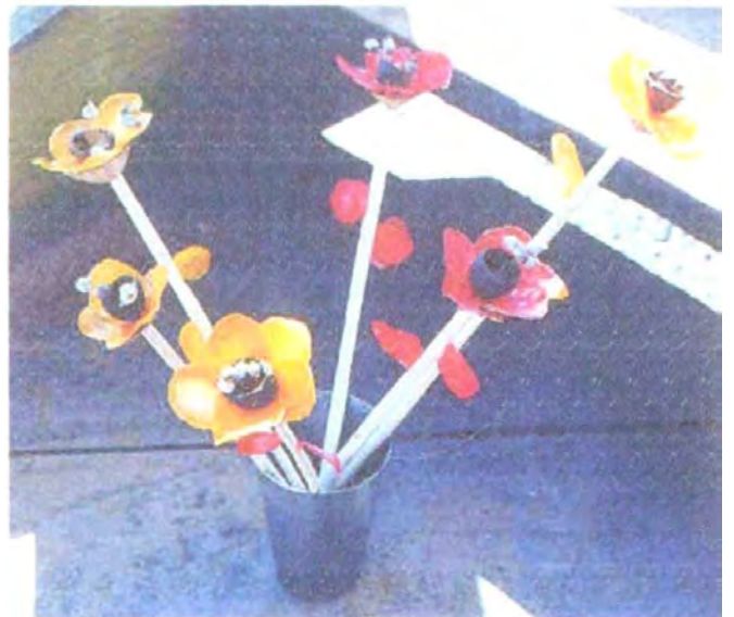
Flores con escamas de pescado, semillas y balsa