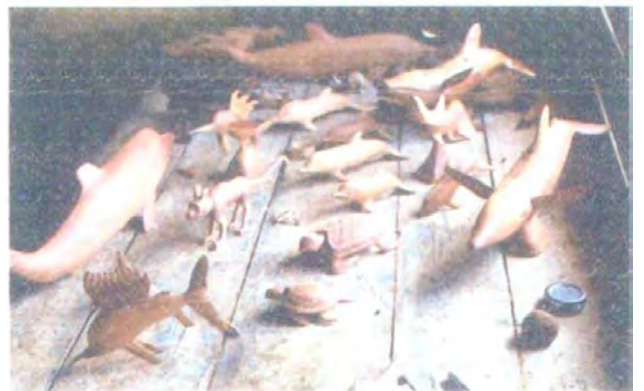
Animales tallados en oquendo

Diseñados y elaborados por Artesanas de El Valle - Bahía Solano