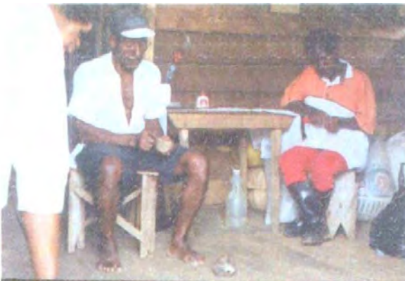
Artesanos tallando tagua