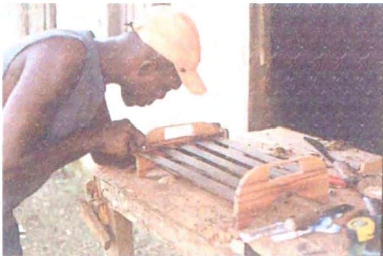
Elaborados por artesanos de Nuquí