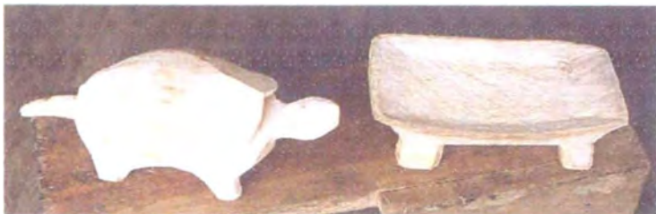
Primeros Modelos elaborados en balsa

Elaborados por artesanos de la Comunidad indígena de Panguí