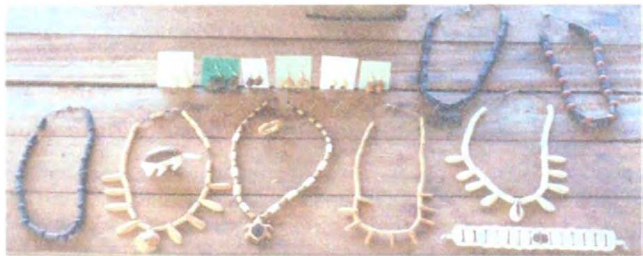
Bisutería en Tagua