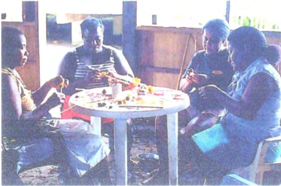
Elaborados por artesanas de Jurubidá - Chocó