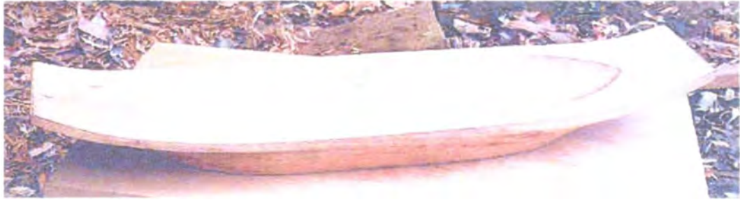
Frutero Canoa tradicional

Rescate de diseños tradicionales y creación de nuevos diseños (éstas muestras todavía no tienen acabados)