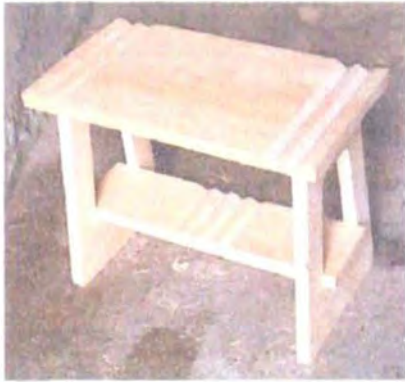
Butaca diseño inspirado en el rayo de lavar