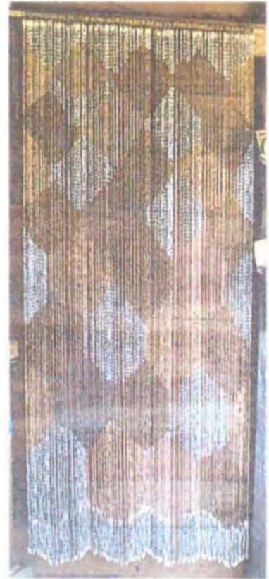
Cortinas en semilla Moisés y conchas