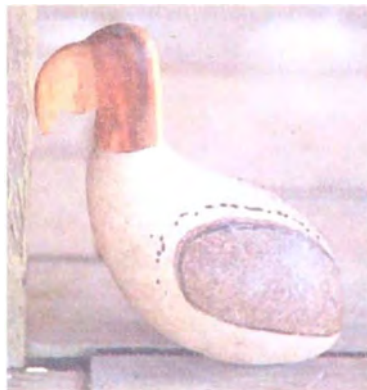
pájaro en oquendo y totumo