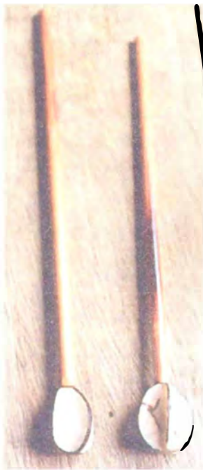
molinillos en oquendo y tagua