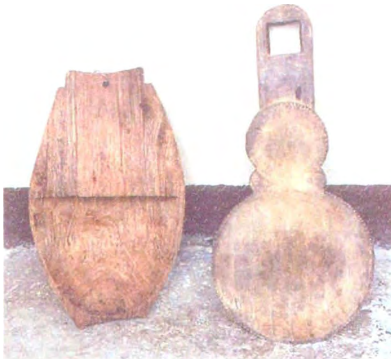
Elaborados por artesanos de Bagadó