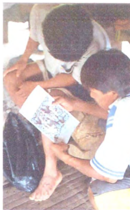
Comunidad indígena de Jurubidá