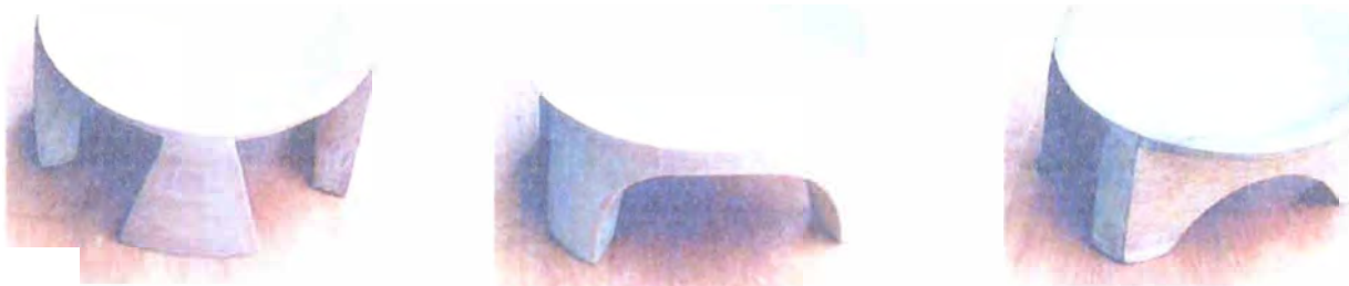
Experimentación en la variación de las patas de bateas