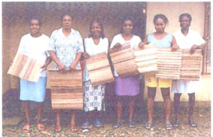
Artesanas de Pie de Pepé