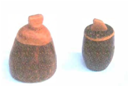
Cofrecitos en coco combinado con madera y tagua