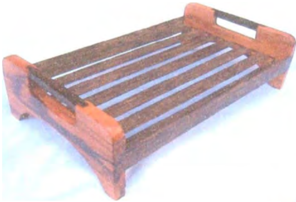
Bandejas en oquendo y chonta