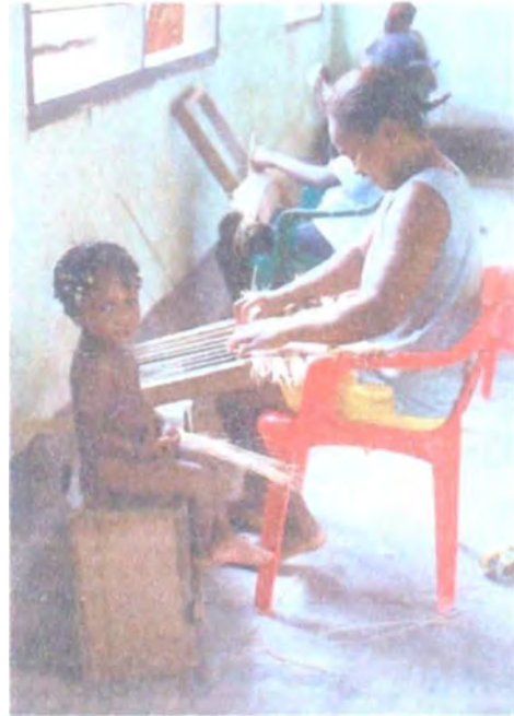
Individuales en platanillo e iraca