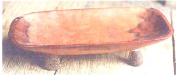
Bandeja en oquendo y patas de tagua