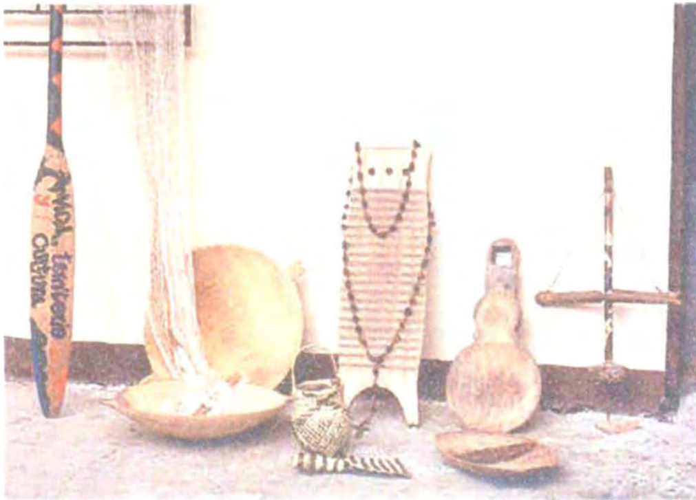
Canaletes, bateas, rayos de lavar, tablas para picar, atarraya, pepenas, canastos, camándula, taladro manual