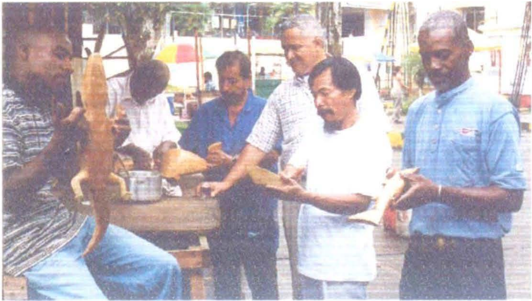
Artesanos de Buenaventura

Productos Referente elaborados por la comunidad artesanal para el mercado turístico.