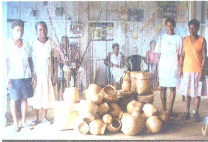
Artesanas con sus canastos de iraca y cortinas de moisés