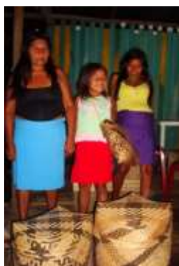
Lugar: Bocas de Víbora, Nariño Fecha : 16/10/2011 Descripción: Mujeres artesanas y niña de la etnia Eperaara Siapidaara, junto a canastos elaboradas con la fibra de chocolatillo.