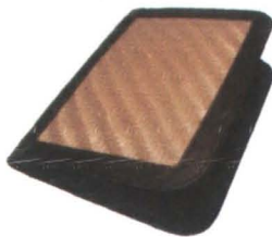
Tejido en Paja Tetera Guapi