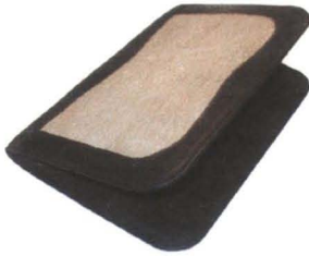
Fibra de Damagua Chocó