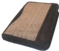
Tejido en Palma de Iraca Aguadas