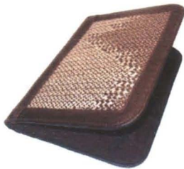
Tejido en Caña Flecha Tuchín (Córdoba)