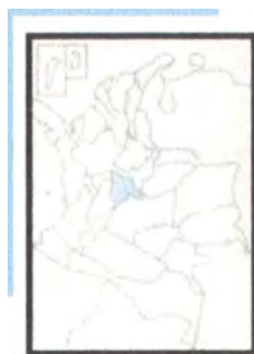
UBICACION DE CUNDINAMARCA EN COLOMBIA

La comunicación se puede hacer por medio del teléfono comunitario del barrio (91) 8675732 o con el fax (91) 8672640.