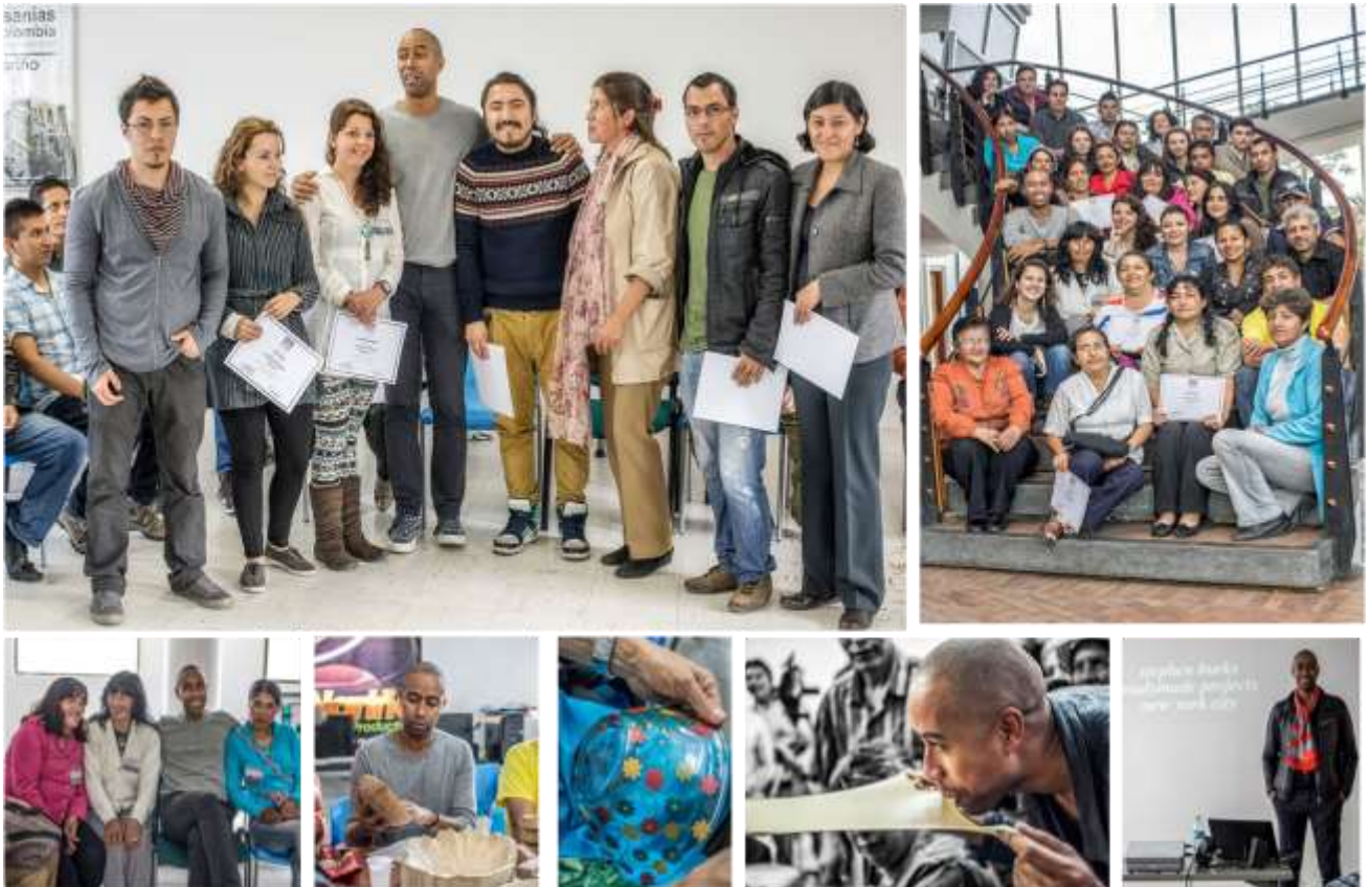
Fotografías: Workshop “identidad de Identidades”, Laboratorio de Nariño, días 18, 19 y 20 de Noviembre 2012