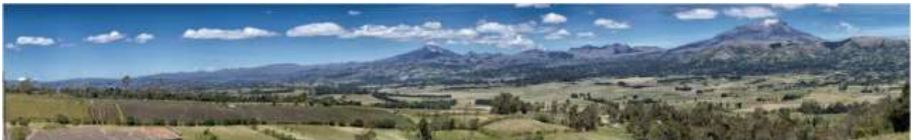
Fotografía: Volcán Cumbal, tomada por Jorge Bolaños, Asesor Laboratorio de Nariño.

D.I. Luisa Fernanda Torres De Los Ríos Asesora Laboratorio de Artesanías de Colombia, sede Nariño