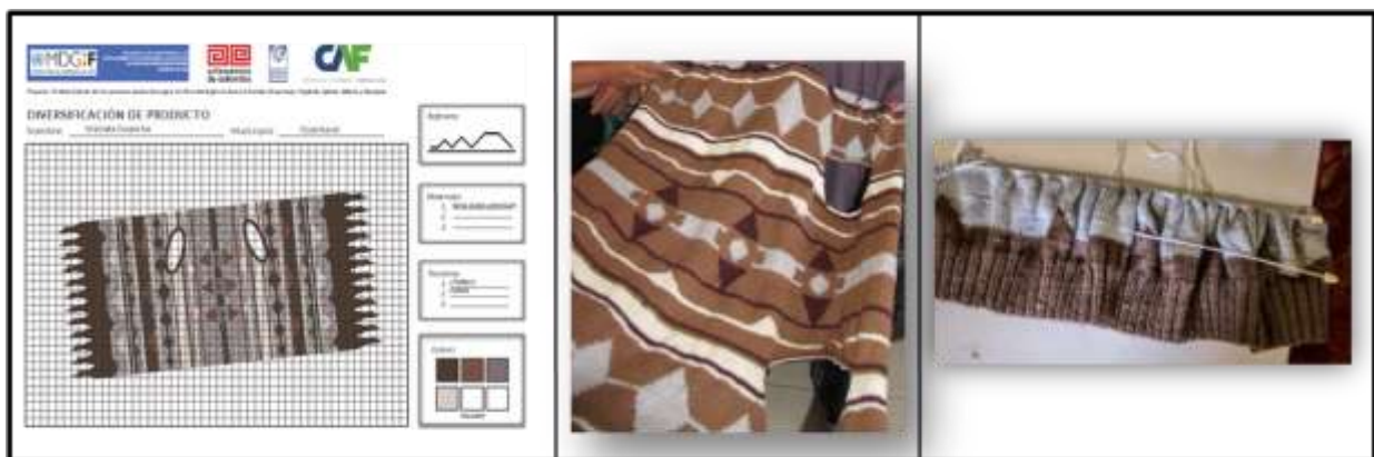
Actividad: Proceso de elaboración de prototipo de un chaleco, Producto del Municipio de Guachucal

A continuación algunos productos y procesos de la elaboración de la producción: