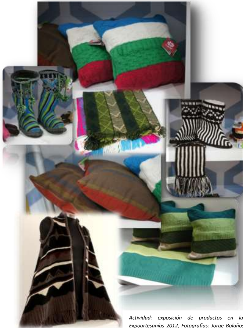
Actividad: exposición de productos en la feria Expoartesanías 2012

Se referenciaron, etiquetaron y se enviaron a la Feria Expoartesanías 2012 en total 34 productos en el Municipio de Carlosama y 39 productos en el Municipio de Guachucal.