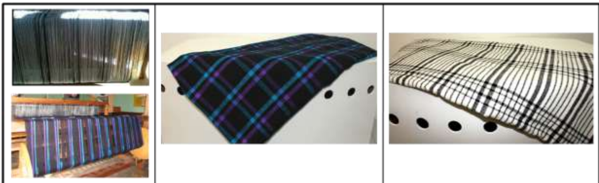
Actividad: Proceso de elaboración de prototipos de paños en telar, Producto del Municipio de Carlosama, Fotografías: Luisa Torres, Artesanías de Colombia S.A.