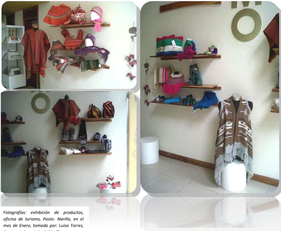
Fotografías: exhibición de productos, oficina de turismo, Pasto- Nariño, en el mes de Enero

Se realizó el montaje de los productos que no tuvieron salida en la feria Expoartesanías 2012, en la Oficina de Turismo de la Ciudad de Pasto, con el fin de ayudar a promocionar y vender los productos desarrollados en el proyecto CAF con la comunidad de los Pastos, se apoyo esta exhibición con la ayuda de publicidad para que haya mayor afluencia de gente, este montaje esta de forma permanente durante un mes hasta el 22 de febrero del 2013.