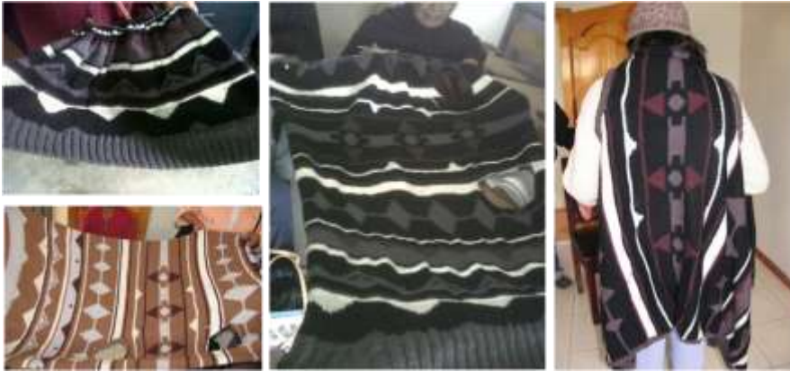
Actividad: Seguimiento a la producción, Municipio de Guachucal. Fecha: mes de Noviembre