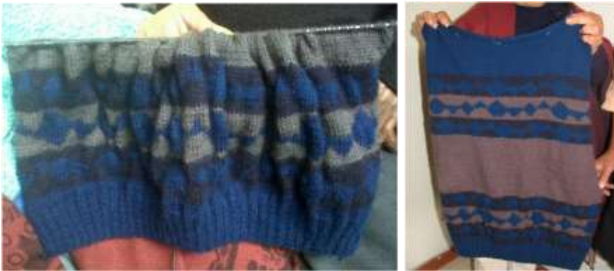
Actividad: Seguimiento a la producción, Municipio de Guachucal. Fecha: mes de Noviembre