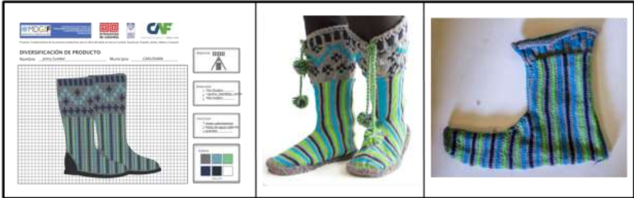
Actividad: Proceso de elaboración de prototipo de un par de botas, Producto del Municipio de Carlosama