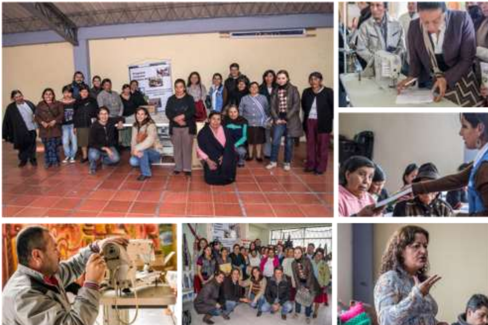
Actividad: entrega de maquinaria en el Municipio de Carlosama y Guachucal, Fotografía: Jorge Bolaños, Luisa Torres- Artesanías de Colombia S.A.