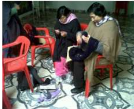
Actividad: elaboración de prototipos y producción, Producto del Municipio de Carlosama y Guachuca, Fotografías: Luisa Torres, Artesanías de Colombia S.A.