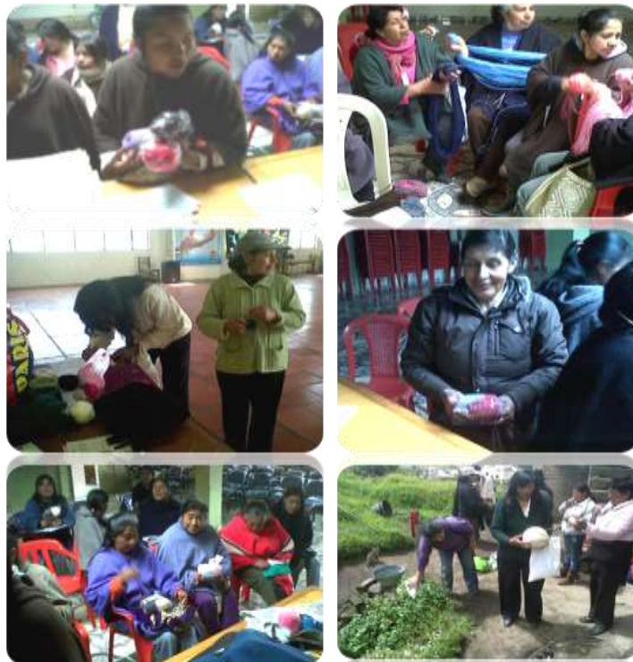
Actividad: entrega de materiales en los Municipios de Carlosama y Guachuca

Luego de brindar asesorías para el desarrollo de los prototipos, se definió las paletas de colores para la producción y posterior compra de materiales, para lo cual se decidió usar lanas acrílicas, hilos y telas, algunas telas y lanas de mayor calidad se usaron para la elaboración de prendas y crear un acabado más selecto donde el producto tenga una mejor presentación, los hilos como el guajiro se utilizaron para la elaboración de calzado y bolsos ya que tienen una mayor resistencia, lo cual se hace perfecto para la función del producto, y finalmente se usaron lanas e hilos como la lana pelada, cable, orlón, entre otras, para la elaboración de la mayor parte de los productos, ya que son materiales fáciles de conseguir, económicos y que proporcionan un buen acabado al producto, todos los materiales se entregaron a cada Artesana beneficiaria de los Municipios de Carlosama y Guachuca que tuviera la habilidad y el compromiso de elaborar el producto y desarrollar la producción, los materiales se distribuyeron cada vez que se realizaba el viaje a zona para el respectivo seguimiento a los productos, se verificaba el avance que habían logrado en el trabajo y se entregaba lo que hacía falta para finalizar el producto.