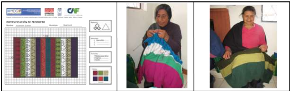
Actividad: Proceso de elaboración de prototipo de una manta para niños, Producto del Municipio de Guachuca, Fotografías: Luisa Torres , Artesanías de Colombia S.A.