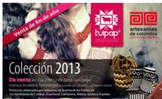
Publicidad: papel opalina, de 25 cm x 17 cm. Hecho por: Jorge Bolaños, asesor laboratorio de Nariño