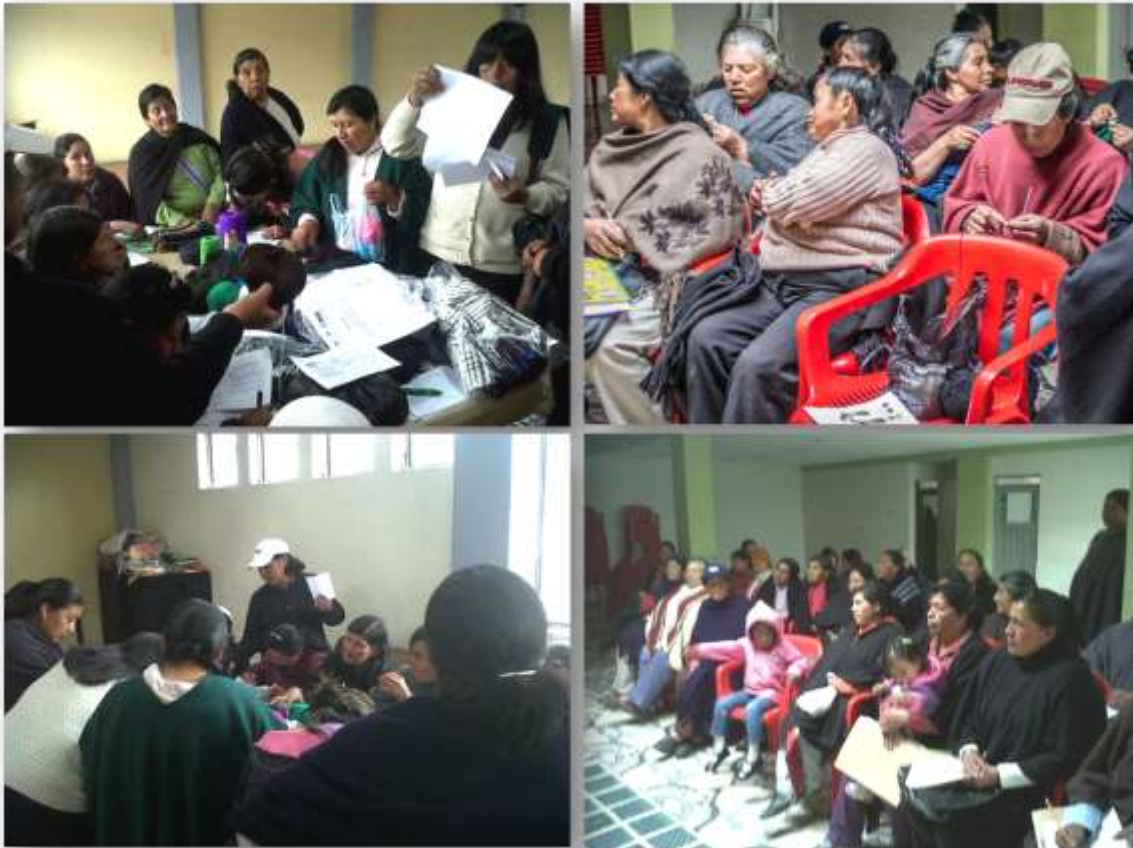
Fotografías: entrega de plata por las ventas en Expoartesanías 2012, Municipios de Carlosama y Guachucal, en el mes de Enero.

En el mes de Enero se realizó un viaje a Carlosama y Guachucal, con motivo de pagar a las Artesanas los productos que se vendieron en la feria Expoartesanías 2012. Para ello se utilizaron unas facturas y un listado donde cada artesana beneficiaria que recibía su pago firmaba, y no haya ningún inconveniente en un futuro, así mismo se explicó cómo fue la feria y las dudas que ellas tenían con respecto a la venta de sus productos, también se comentó la exhibición de los productos en la oficina de turismo y en el almacén de Artesanías de Colombia – sede Pasto, con lo cual estuvieron en total acuerdo.