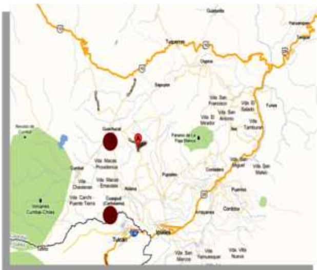
Ubicación de los Municipios de Guachucal y Cuaspúd- Carlosama al sur del Departamento de Nariño

Guachucal limita así: al norte, con el municipio de Sapúyes; al sur, con los municipios de Cumbal y Cuaspúd; al oriente, con los municipios de Aldana y Pupiales y al occidente con los municipios de Mallama y Cumbal.