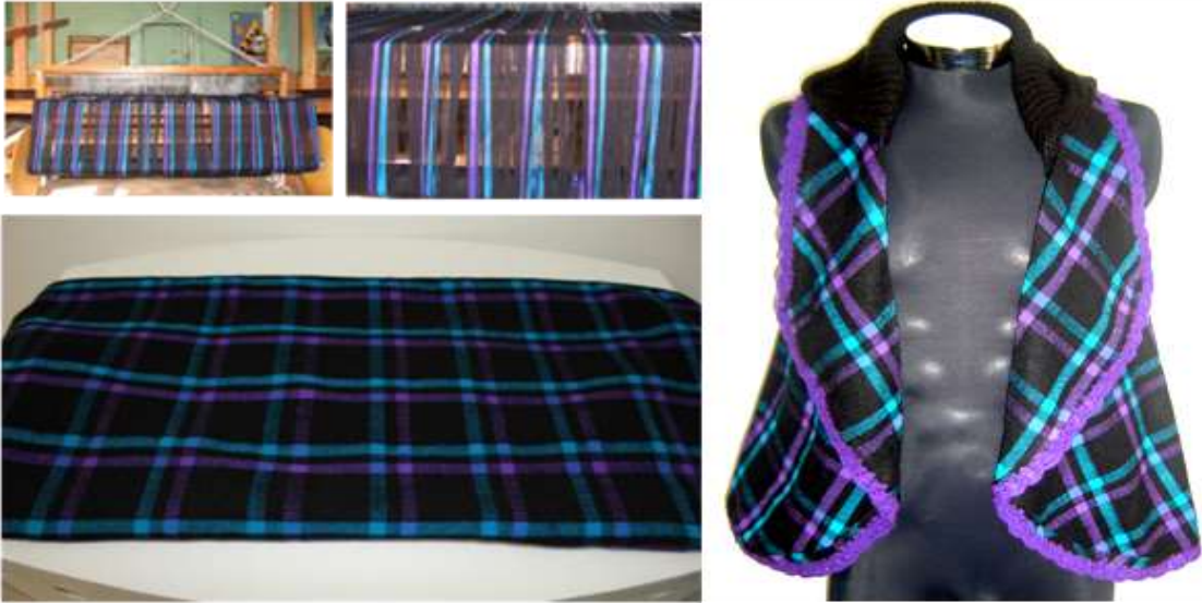
Actividad: Seguimiento a la producción, Municipio de Carlosama Fecha: mes de Noviembre, Fotografía: Luisa Torre, Jorge Bolaños-Artesanías de Colombia S.A.