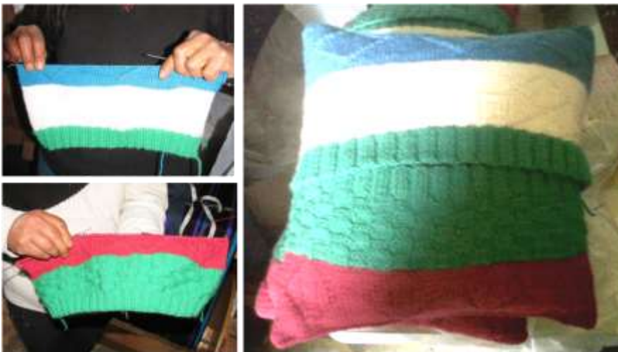
Actividad: Seguimiento a la producción, Municipio de Carlosama Fecha: mes de Noviembre, Fotografía: Luisa Torres-Artesanías de Colombia S.A.