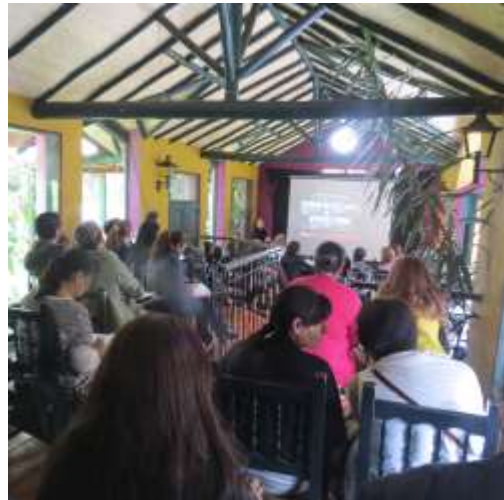
Consejo Regional, noviembre 24 de 2016, Municipio de Tenjo, Foto Tomada por Liliana Peña, Gestora Laboratorio Cundinamarca Artesanías de Colombia.