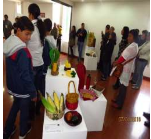
Exposición de la Asociación chía Artesanos “Leyenda del Maíz” 1 de Julio de 2016