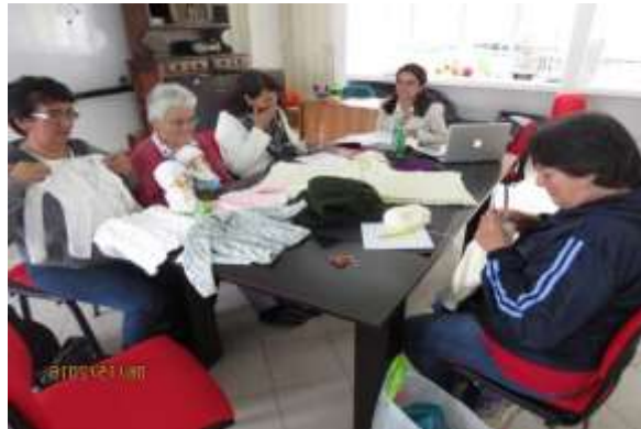
Asesoría puntual Artesanas de Sopó” 15 de Julio de 2016