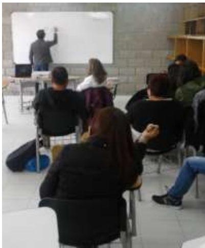
Comité de Diseño, Sopó - Cundinamarca 22 de agosto de 2016