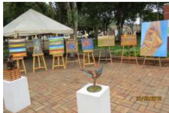
Día del Artesano y Feria Artesanal, 9 de octubre de 2016, Municipio de Tenjo- Cundinamarca