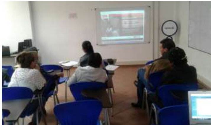
Rendición de cuentas 21 de noviembre Municipio de Tenjo, Foto Tomada por Liliana Peña, Gestora Laboratorio Cundinamarca Artesanías de Colombia.