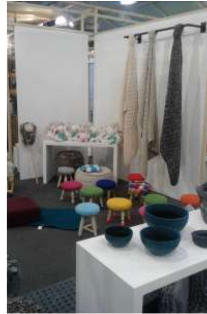
Atención Stand Expoartesánías, Foto Tomada por Liliana Peña, Gestora Laboratorio Cundinamarca Artesanías de Colombia.