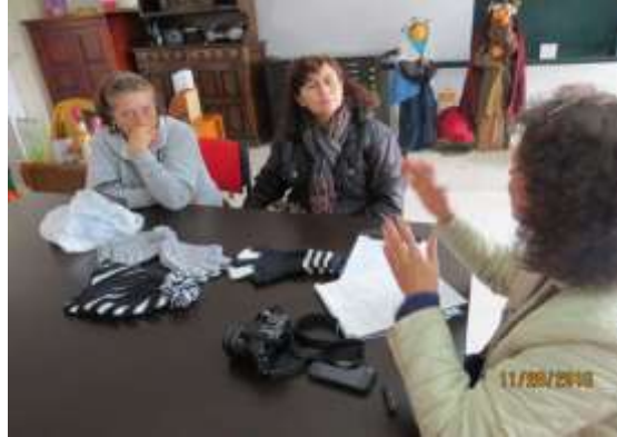
Asesoría puntual Artesanas de Sopó, noviembre 28 de 2016, Foto Tomada por Liliana Peña, Gestora Laboratorio Cundinamarca Artesanías de Colombia.