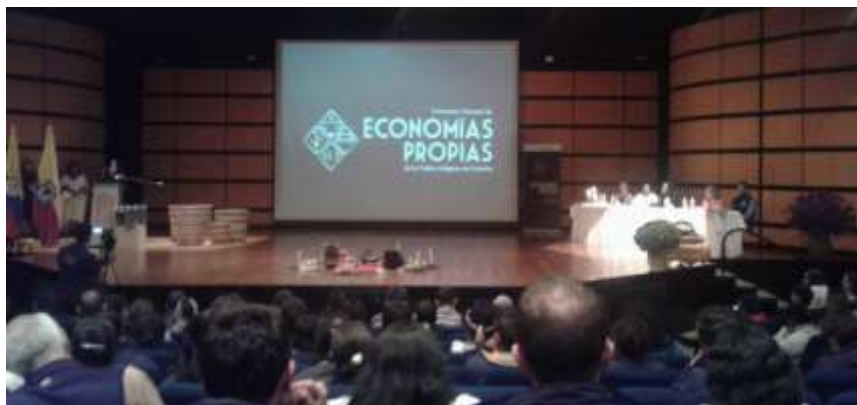
Participación en presentación economías propias en Corferias, Foto Tomada por Liliana Peña, Gestora Laboratorio Cundinamarca Artesanías de Colombia.