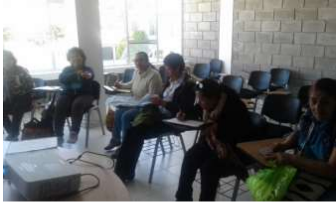
Asesoría en Diseño Proyecto Gobernación, Fundación Firmes Municipio de Sopó