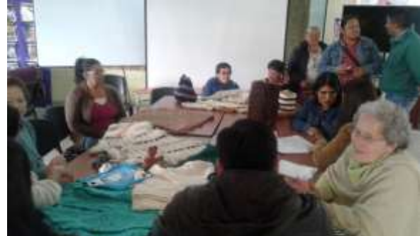
1. Asesoría Puntual Artesanas de Sopó, Mayo 25 de 2016, 2. Evaluación de Producto Municipio de Sesquile, Junio 3 de 2016, fotos tomadas por Liliana Peña, Gestora Laboratorio Cundinamarca, Artesanías Colombia.