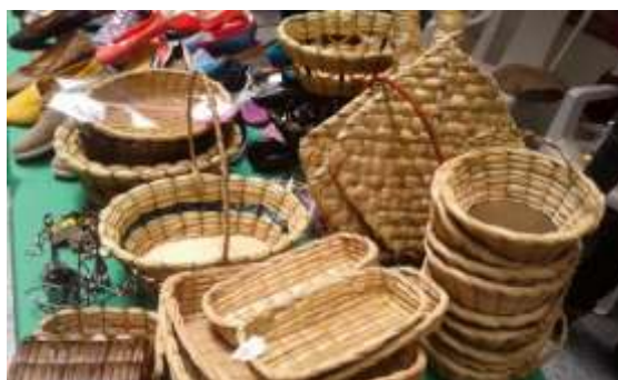
Segunda Muestra Empresarial de la Federación Departamental de Mujeres Campesinas de Cundinamarca FEDEMUCC