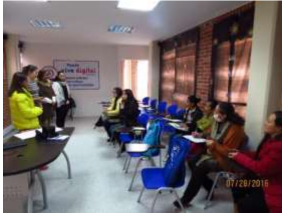
Evaluación de producto, Villapinzón – Cundinamarca 28 de Julio de 2016