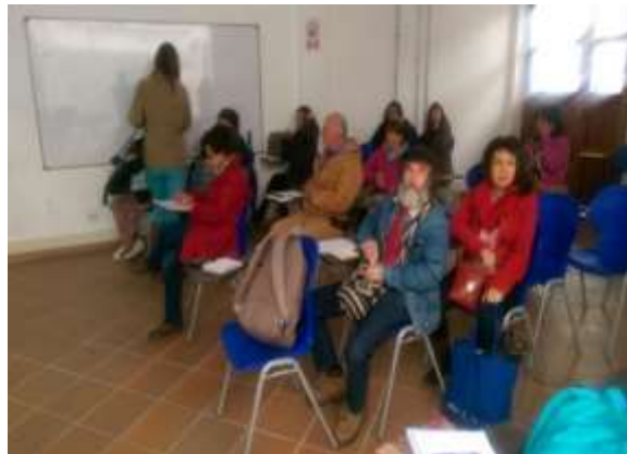
Apertura Laboratorio en Tenjo 4 de agosto de 2016, Foto Tomada por Santiago Rorpasante Universidad de la Sabana.