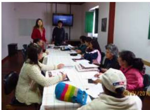
Taller Innovación y Creatividad, 1 de septiembre de 2016, Fundación Firmes, Sopó- Cundinamarca,