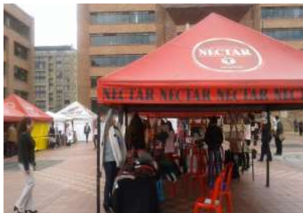
Feria Semanal Cundinamarca - Gobernación 12 de Julio de 2016