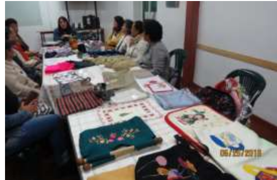
Reunión Artesanas Fundación Firmes , Prodensa Municipio de Sopó, 25 de Mayo de 2016