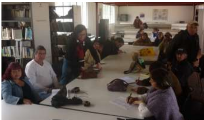
Foto reunión con grupo de artesanos de Guatavita en la Biblioteca.

Siendo un pueblo muy importante para la memoria histórica del departamento, gracias a la cercanía de la Laguna de Guatavita, debería tener una colección de muestras artesanales del municipio permanentemente en algún lugar para potencializar la oferta comercial de sus productos y así poder tener la posibilidad de vender con mayor frecuencia su producción.