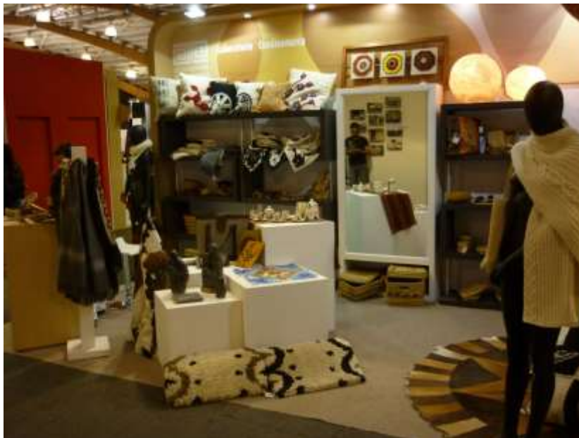
Foto 1 Estand del Laboratorio de diseño en Expo artesanías 2013.

Por último se anexan en archivo en el File Maker documentos de registro tanto de artesanos como de productos artesanales.