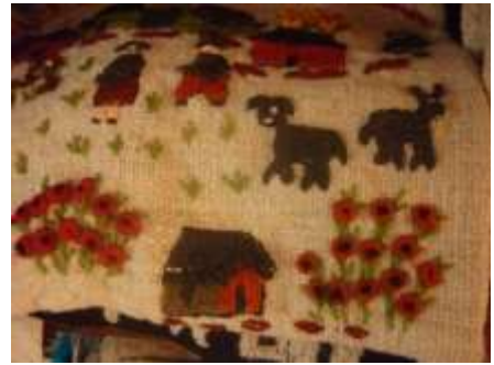
Algunos Integrantes del laboratorio de Chía Producto Referente (Tapiz)