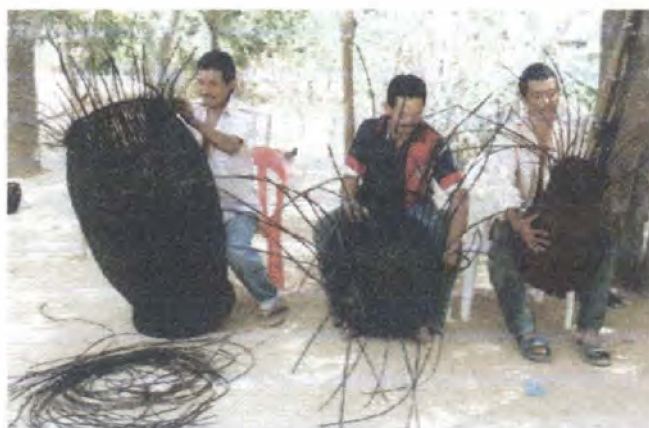
Optimización de la producción / Guaimaral - Atlántico

En el Departamento del Huila, Municipio de Suaza se llevó a cabo la asesoría en el oficio de sombrerería en fibra de iraca a 11 artesanas para el rescate de tejidos tradicionales. Dentro de los logros se resalta la asesoría para el rescate de diseños tradicionales en los tejidos y la iniciación de una propuesta de línea de cojinería manejando cintas de iraca ancha para su acopio en la elaboración de los cojines.