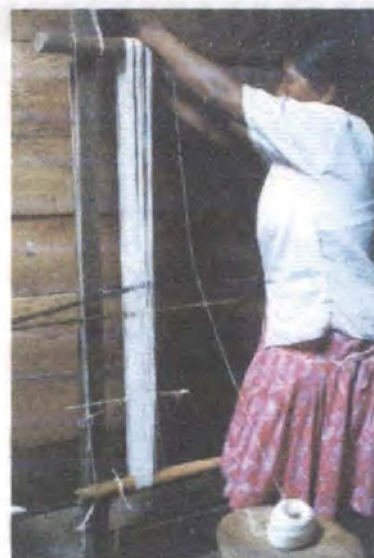
Elaboración de prototipos/ Sibundoy - Putumayo