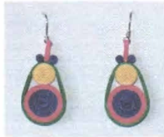
Línea de accesorios en filigrana de papel / Mesitas del Colegio - Cundinamarca