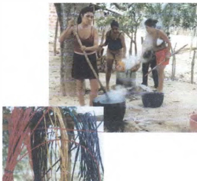
Taller de tintes / Guaimaral - Atlántico

En los Departamentos de Huila, Atlántico y Antioquia se realizaron cuatro talleres de tintes industriales en los municipios de San Agustín, Tello, Guaimaral y Turbo respectivamente, en el cual participaron 66 artesanos. Se realizó el afianzamiento técnico y practica en el manejo de tintes industriales para fibra de plátano y bejucos, con colorantes industriales, implementando medidas más exactas y carta de color.