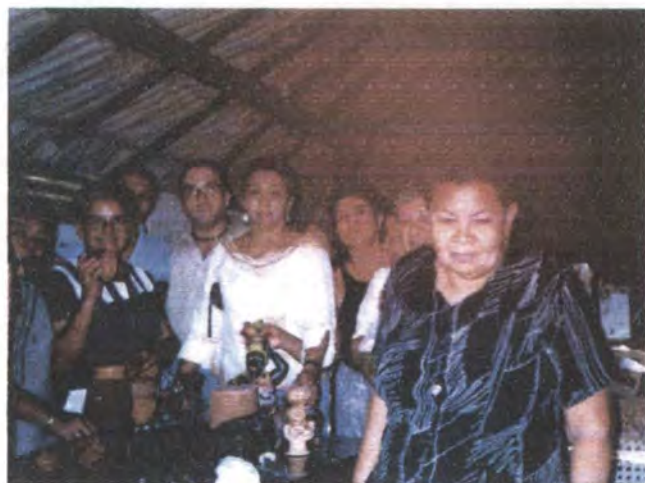
Quema de prototipos elaborados en la asesoría (fotografías derecha)