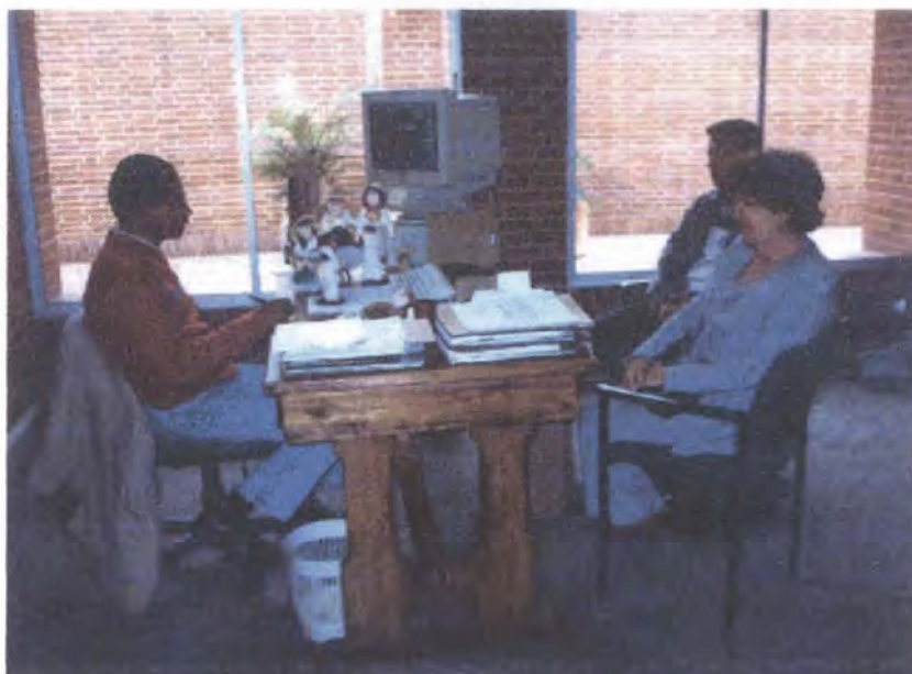
Asesoría puntual - Plaza de los artesanos

Con la Comunidad artesanal del Municipio de Tuquerres se le viene prestando asesoría en diseño, realizando con ellos un proceso de experimentación con material reciclable, logrando unas muestras excelentes, para pasar a la fase posterior de definición de productos. Con los demás artesanos se realizaron actividades tendientes a mejorar la calidad de sus productos, sus acabados y el proceso de tinturado de la fibra, logrando un óptimo resultado.