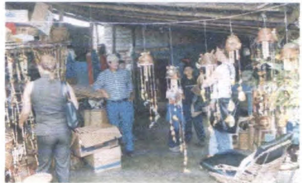
Presentación muestras talleres artesanales Popayán (izquierda) Timbio (arriba derecha - abajo)