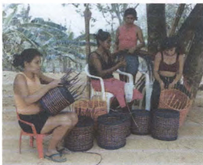
Seguimiento a procesos productivos / Guaimaral - Atlántico

En el Atlántico, municipios de Guaimaral y Soledad se asesoró a los grupos para mejorar la calidad de los productos existentes y lograr su diversificación con nuevas líneas de productos. De igual manera, se realizó el seguimiento a los procesos productivos de los productos considerados exitosos, la optimización de tiempos de producción, la capacidad de respuesta de cada grupo y la reducción de costos. A éstos grupos artesanales igualmente se les capacitó en los temas relativos a costos y calidad. Se realizaron diseños de butacas inspirados en los temas del "Carnaval de Chivolo". Se realizó la producción de 42 contenedores en diferentes tamaños y colores para atender los requerimientos del área comercial.