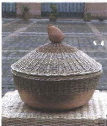
Prototipos en cerámica / Guaduas - Cundinamarca