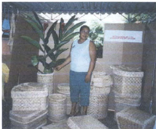
Asesoría en exhibición de productos / Apartadó - Antioquia

En el Departamento de Antioquia, municipios de Turbo y Apartadó, en el oficio de cestería en calceta de plátano y banano, se logró el desarrollo de productos y el apoyo a las practicas realizadas con los prototipos de la máquina laminadora de calceta, secado de la fibra y pruebas de extracción de hilos. Se trabajó en el cálculo de costos y precios de los productos. Se realizó el refuerzo sobre el tinturado de la calceta de plátano y banano. Se capacitó en dos tejidos diferentes a los utilizados en los productos tradicionales y el desarrollo de muestras de nuevos productos en calceta como contenedores tafetán, tanto verticales como horizontales combinando colores (blanco y negro y blanco y rojo), un contenedor esquinero e individuales en blanco y negro.