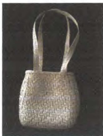
Bolso Palma Real (izquierda) Collar en Semillas (derecha arriba) Collar en combinación con plata (derecha abajo)

En el Departamento de Cundinamarca, Municipio de Puerto Salgar se atendieron 9 artesanas involucradas en los oficios de cerámica y trabajos en semillas. Se realizó la asesoría en diseño para el mejoramiento de la calidad, rescate de productos y técnicas tradicionales. Se elaboraron accesorios en semillas y bolsos en palma, al igual que la elaboración de calados en cerámica utilizados para ventilación en viviendas.