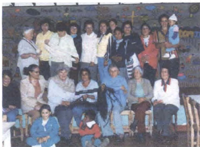
Grupo artesanal / Chía - Cundinamarca

Productos prototipo / San Agustín - Huila (fotografías derecha abajo)