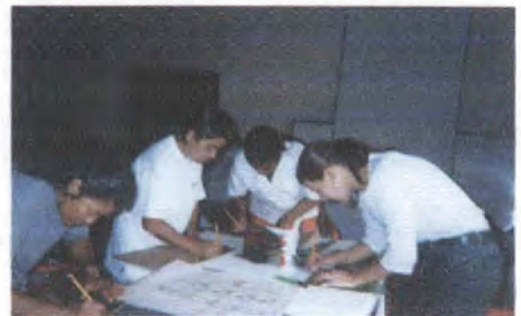
Desarrollo prototipos empaques/Tibaná - Boyacá (arriba) Taller en elaboración de empaques/ Tipacoque - Boyacá (abajo)