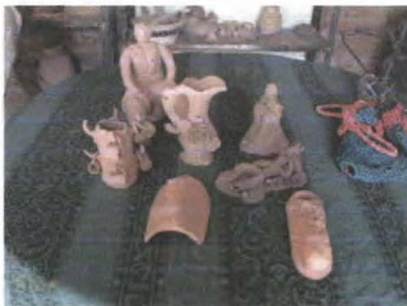
Revisión hornos de quema y muestra de productos referente para asesoría Villanueva - Santander