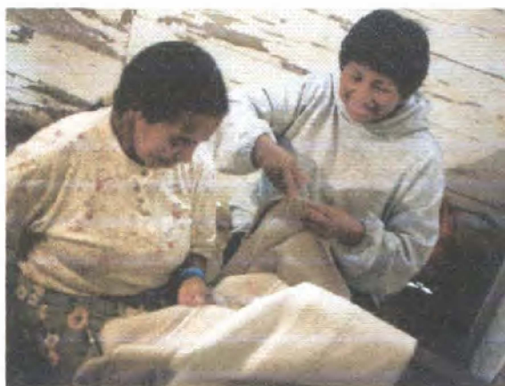
Elaboración de prototipos/ Sibundoy - Putumayo