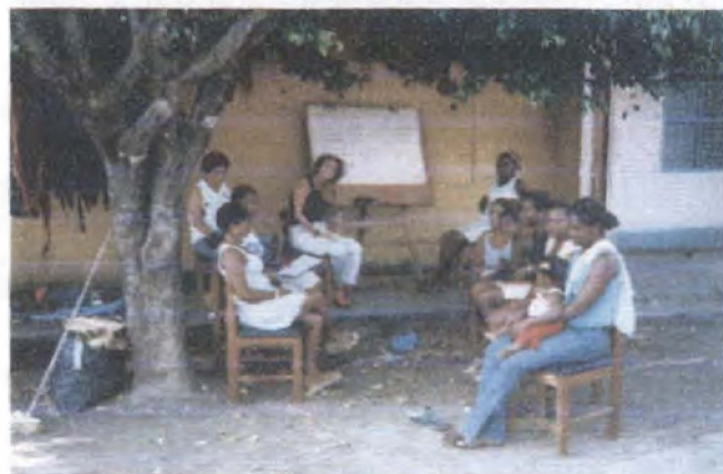
Taller de creatividad / Turbo - Antioquia