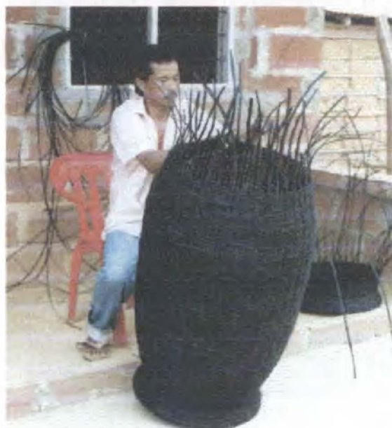
Optimización de la producción / Guaimaral - Atlántico