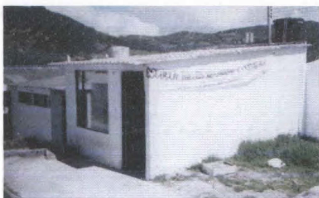
Elaboración de prototipos (fotografía derecha arriba) Prototipos elaborados (fotografía izquierda abajo) Centro artesanal (fotografía derecha abajo) La Calera - Cundinamarca