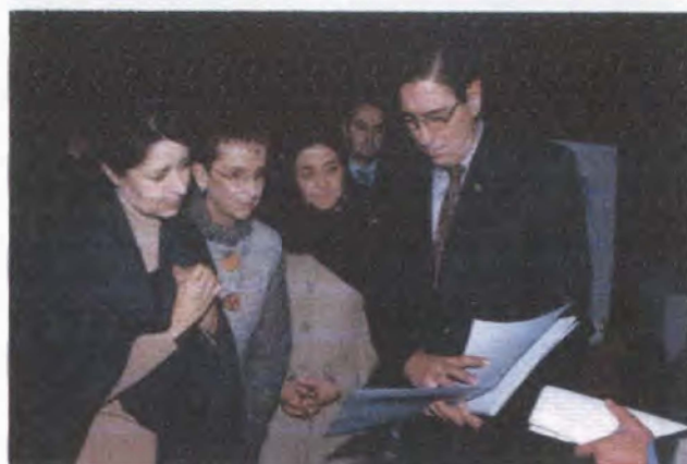
Entrega Certificados de Calidad Icontec a talleres artesanales Plaza de los Artesanos - Bogotá