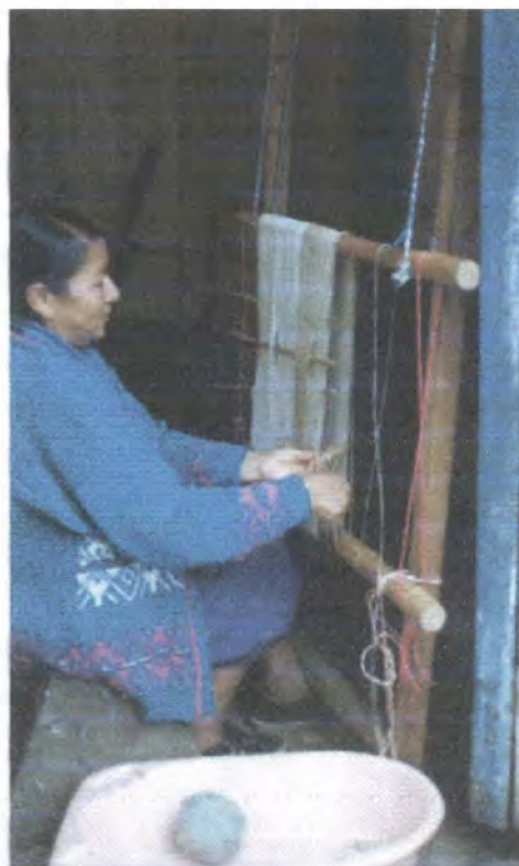
Elaboración de prototipos/ Sibundoy - Putumayo

En el Departamento del Cauca, municipios de Guapi, Piendamó y Silvia se realizó la asesoría en diseño para la diversificación y desarrollo de nuevos productos, mejoramiento de la calidad y consolidación de líneas de productos. En el Municipio de Guapi, en el oficio de cestería en paja tetera, se elaboraron nuevos productos y se trabajó en la preparación de material y tejidos para los siguientes productos: Línea de bolsos con 4 diseños, Línea de individuales con 6 diseños, Línea de caminos de mesa y paneras con 5 diseños.