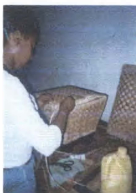
Elaboración de prototipo / Turbo - Antioquia