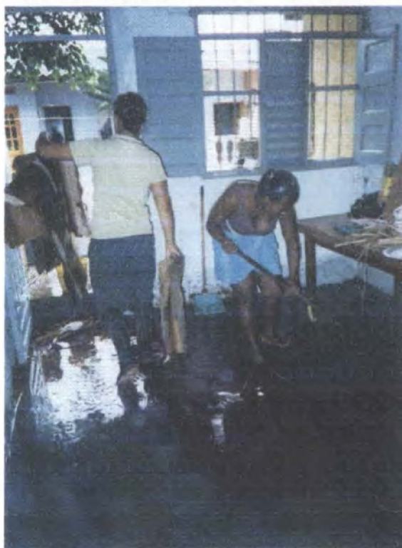
Inundación del municipio / Turbo - Antioquia