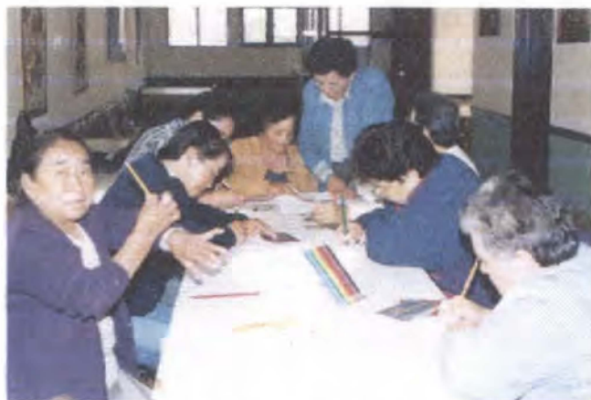
Taller de Creatividad / Chía - Cundinamarca