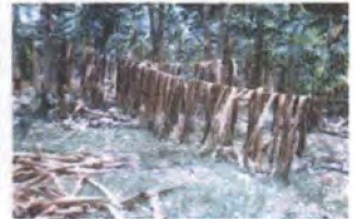
Recolección materia prima y secado / Apartadó - Antioquia

En el municipio de Turbo, se realizó la presentación y divulgación de los objetivos de la asistencia técnica para la adecuación de equipos y herramientas al grupo de artesanos. Desplazamiento a la Vereda el Tres para realizar pruebas de campo y pruebas de funcionalidad del prototipo del laminador y visitas a las plantaciones bananeras como fuente de materia prima, para la recolección de muestras de calceta de plátano y banano secada al sol. Se realizó un análisis de las características del proceso laminador con el prototipo. Realización de pruebas con muestras de calceta de diferentes tamaños, grosor y longitud