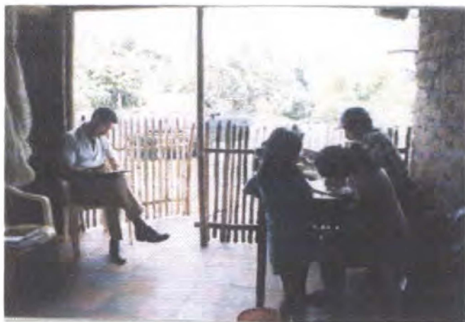
Taller creativo / Piendamó - Cauca

En el departamento de Boyacá se realizaron talleres de creatividad en los municipios de Cerinza, Mongui, Tipacoque y Duitama tendientes a desarrollar propuestas de empaque e identidad gráfica para cada uno de los talleres participantes.