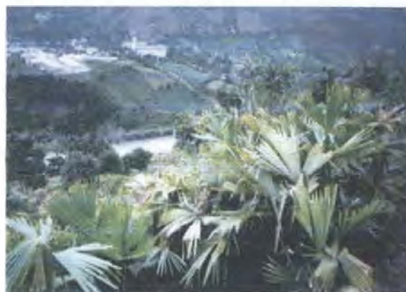
Cultivo Iraca / Linares -Nariño

Se dió continuidad al acompañamiento de las cuatro parcelas o núcleos demostrativos que fueron sembrados en el Municipio de Linares, Nariño y se suscribe un acuerdo con el Municipio de Colón Génova para la siembra de una parcela en dicho municipio como cultivo demostrativo, que incentive las siembras para el abastecimiento del creciente mercado.