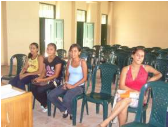
Lugar: Salón de reuniones Alcaldía de Ambalema Fecha : febrero 9 de 2009 Descripción: Grupo de participantes