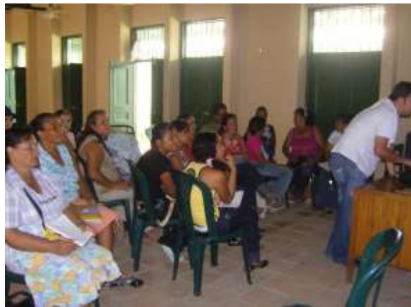
Lugar: Salón de reuniones Alcaldía de Ambalema Fecha : febrero 9 de 2009 Descripción: Grupo de participantes