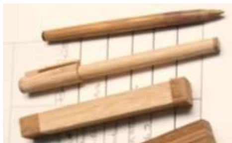
Fotografía Beatriz Muñoz M -visita diagnóstico - Artesanías de Colombia

Productos evaluados: El beneficiario seleccionó su línea de lapiceros para la intervención en diseño.