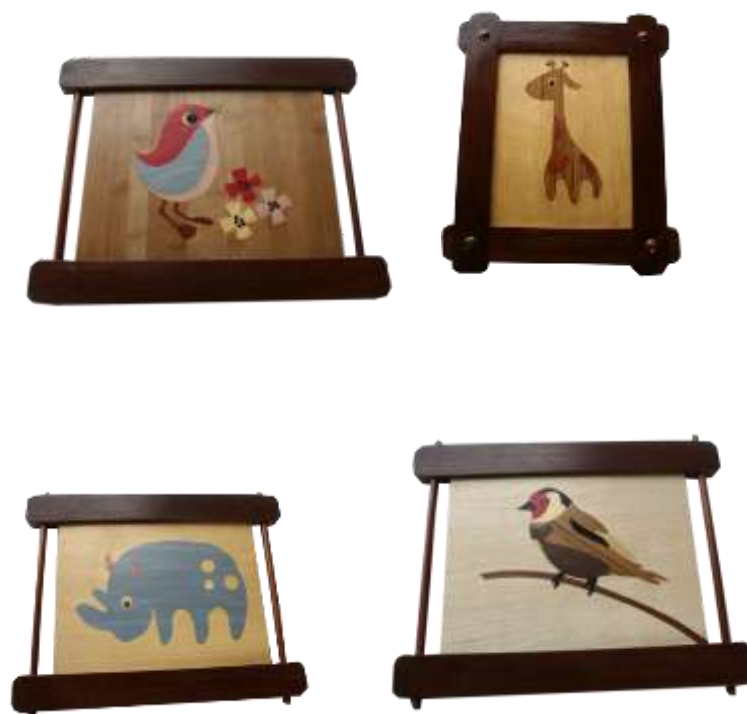
–Resultados- Artesanías de Colombia

Resultado: La unidad productiva logró excelentes acabados en las piezas buena interpretación en los diseños. Además del buen manejo del color, llevando así a excelentes términos su proceso en el proyecto.