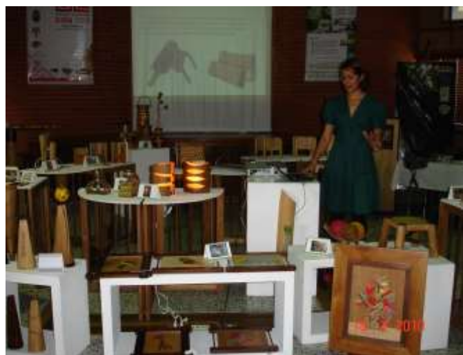
Socialización Proyecto Bosques Flegt.