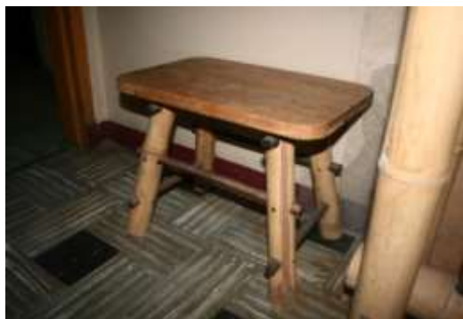
Fotografía Beatriz Muñoz M -visita diagnóstico - Artesanías de Colombia

Productos evaluados: La unidad productiva presentó para su diagnóstico piezas de guadua curvada desarrolladas en el CDA sobre las cuales se encontró la factibilidad de complementar las líneas de producto, por otro lado las butacas de madera y guadua.