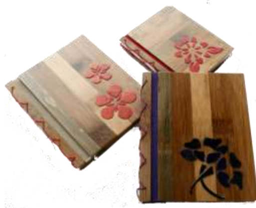
Fotografía Beatriz Muñoz M –Resultados- Artesanías de Colombia