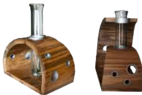
–Resultados- Artesanías de Colombia

Resultado: La unidad productiva desarrolló con un excelente nivel y acabados los diseños propuestos, logrando nivelar sus productos a los estándares de calidad y acabados sugeridos dentro del proyecto.