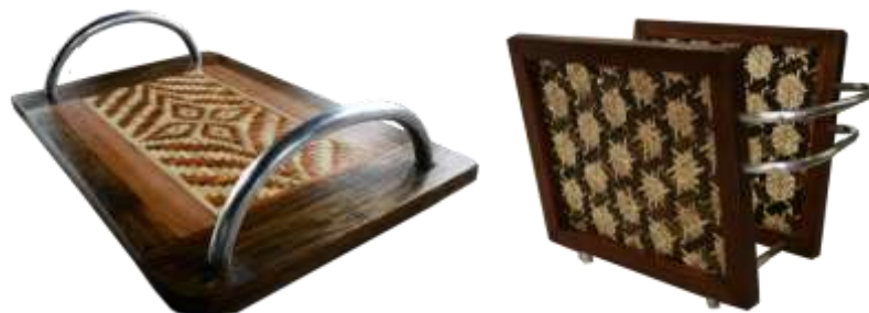
–Resultados- Artesanías de Colombia