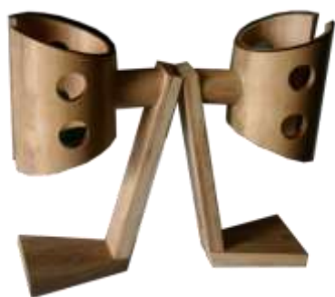
Modelado Digital Beatriz Muñoz M –Intervención en Diseño-Artesanías de Colombia

Resultado: La unidad productiva desarrolló con gran destreza el diseño del objeto de iluminación, sin embargo no presentó para evaluación la propuesta del móvil mariposa.