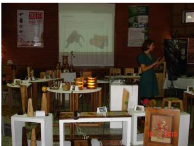
Socialización Proyecto Bosques Flegt.