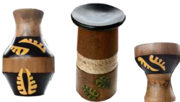
Fotografía Beatriz Muñoz M –Resultados- Artesanías de Colombia