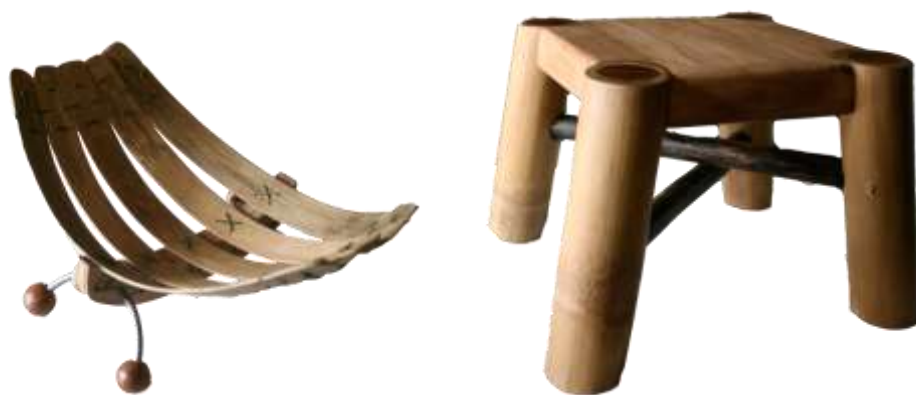
Fotografía Beatriz Muñoz M –Resultados- Artesanías de Colombia

Resultado: La unidad productiva mediante ajustes al diseño para la producción logró reproducir los diseños con éxito, aplicando técnicas productivas de estandarización, obteniendo buenos acabados y la generación de los objetos repetidas veces guardando las proporciones.