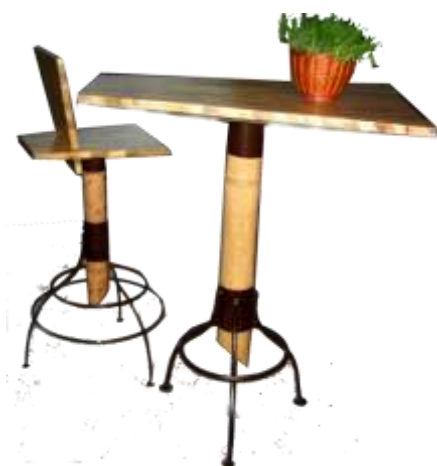
Fotografía Beatriz Muñoz M –Resultados- Artesanías de Colombia

Resultado: La unidad productiva desarrolló los diseños con gran prontitud culminando su proceso de producción y prototipos con suficiente tiempo para realizar correcciones estructurales que ayudaron a que el resultado fuera bueno. Buenos acabados y buen aporte en materia estructural caracterizaron estos prototipos.