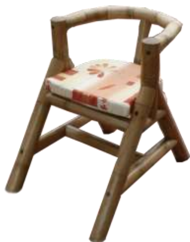
Fotografía Beatriz Muñoz M –Resultados- Artesanías de Colombia