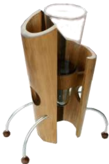
–Resultados- Artesanías de Colombia