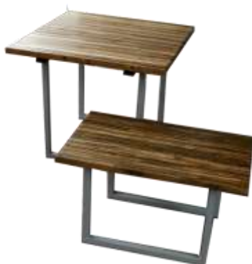
–Resultados- Artesanías de Colombia

Resultado: La unidad productiva presentó inconvenientes en el taller durante el proceso de ejecución de los diseños ya que miembros especializados en el manejo de resida se encontraron inhabilitados temporalmente para realizar dicha labor. Sin embargo se plantearon alternativas diferentes desde el dibujo a mano alzada con las cuales se simplificaron los diseños aplicando las técnicas básicas del taller.