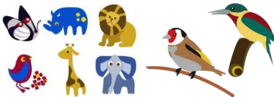
Modelado Digital Beatriz Muñoz M –Intervención en Diseño-Artesanías de Colombia

Resultado: La unidad productiva logró excelentes acabados en las piezas buena interpretación en los diseños. Además del buen manejo del color, llevando así a excelentes términos su proceso en el proyecto.