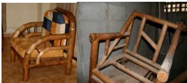
Fotografía Beatriz Muñoz M -visita diagnóstico - Artesanías de Colombia

Productos evaluados: Se evaluaron muebles de sala curvos y rectos