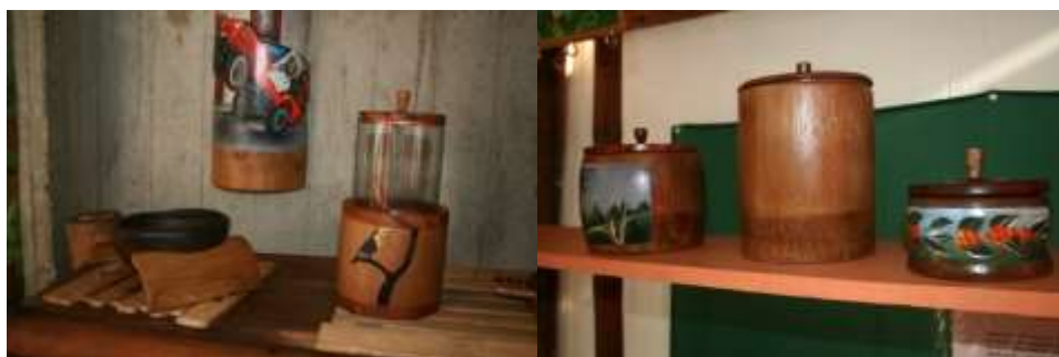
Fotografía Beatriz Muñoz M -visita diagnóstico - Artesanías de Colombia

Productos evaluados: Se evaluaron objetos en guadua rolliza tales como bomboneras y contenedor de guadua con vidrio.