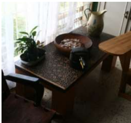
Fotografía Beatriz Muñoz M -visita diagnóstico - Artesanías de Colombia

Productos evaluados: Durante el diagnóstico la unidad productiva presentó para evaluación productos de mobiliario auxiliar para el caso mesas acabadas en resina con rodajas de guadua inmortalizada sobre estructura en madera maciza.