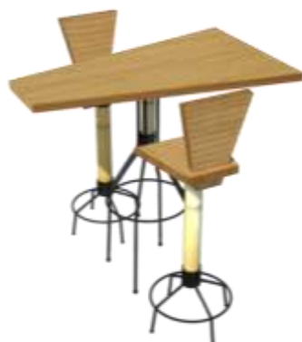
Modelado Digital Beatriz Muñoz M –Intervención en Diseño-Artesanías de Colombia

Resultado: La unidad productiva desarrolló los diseños con gran prontitud culminando su proceso de producción y prototipos con suficiente tiempo para realizar correcciones estructurales que ayudaron a que el resultado fuera bueno. Buenos acabados y buen aporte en materia estructural caracterizaron estos prototipos.