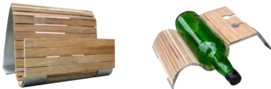
–Resultados- Artesanías de Colombia

Resultado: La unidad productiva desarrolló con un buen nivel y acabados los diseños propuestos en el proyecto, logrando explotar la versatilidad que puede tener la tablilla de guadua, sin embargo aún falta por resolver el tema del pegante ideal existente en el mercado para lograr el nivel de acabados idóneo.