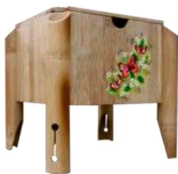
Fotografía Beatriz Muñoz M –Resultados- Artesanías de Colombia