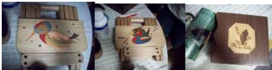
visita diagnóstico Artesanías de Colombia

Productos evaluados: Butacas plegables con motivos infantiles, cofres tipo joyero con motivos de la naturaleza.