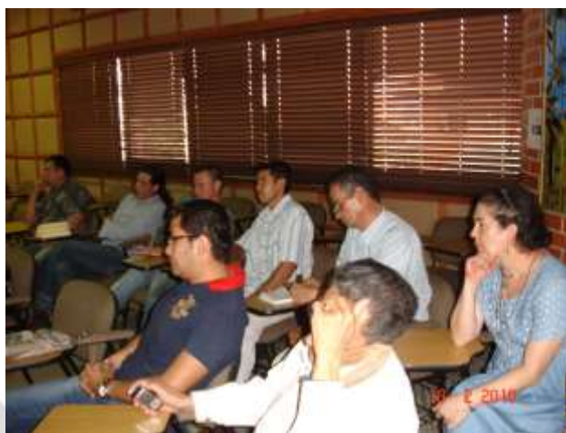
Socialización Proyecto Bosques Flegt.