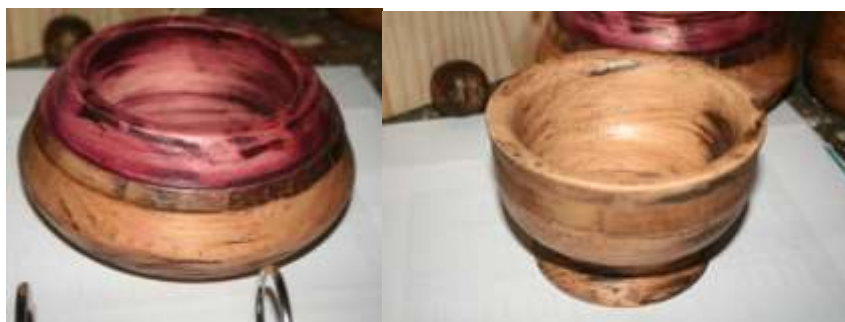
Fotografía Beatriz Muñoz M -visita diagnóstico - Artesanías de Colombia

Productos evaluados: La unidad productiva presentó para su diagnóstico piezas de madera torneada con motivos tradicionales, con apliques y acabados en pátinas, se concluyó que dentro de los rediseños era necesario renovar las formas y pulir los acabados.