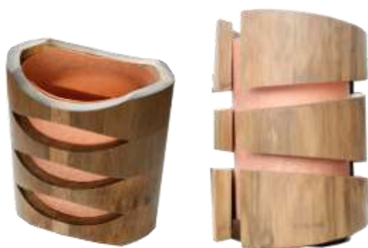
–Resultados- Artesanías de Colombia

Resultado: La unidad productiva desarrolló con gran destreza los diseños planteados en este proyecto sin dificultades y con buen manejo de la técnica logró reproducir las piezas con una excelente calidad.