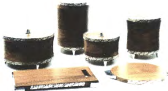
LINEA COMEDOR: ANILLO SERVILLETERO, FLORERO, FRUTERO, AZUCARERA, SALERO, PORTA VASOS.