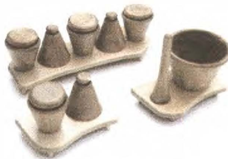
LINEA COCINA: SAL & PIMIENTA, MORTERO, CONDIMENTERO.