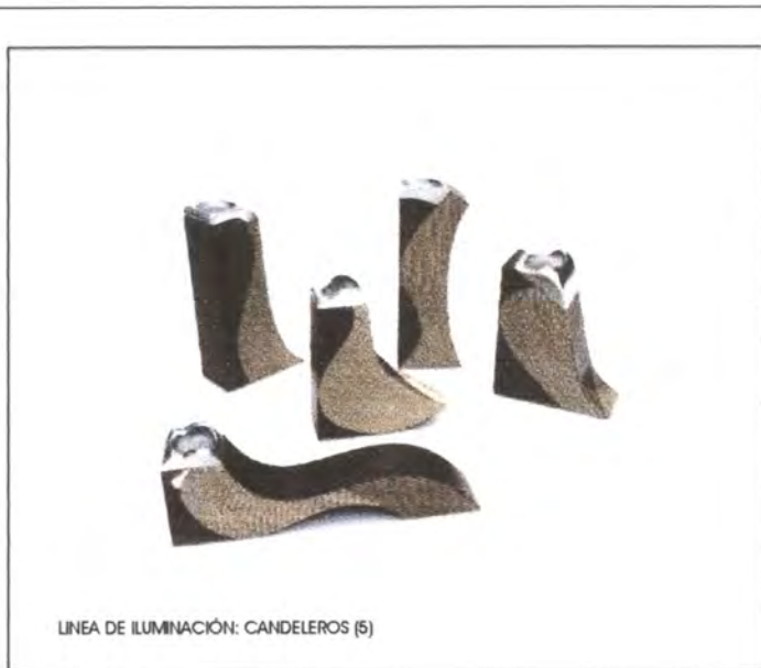
LINEA DE ILUMINACIÓN: CANDELEROS (5)