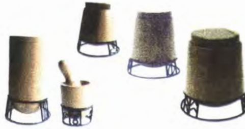
LINEA COCINA: CONTENEDORES DE AZUCAR, SAL, CAFE , PASTAS Y UN MORTERO.