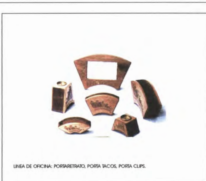
LINEA DE OFICINA: PORTARETRATO, PORTA TACOS, PORTA CLIPS.