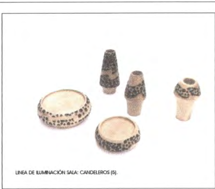
LINEA DE ILUMINACIÓN SALA: CANDELEROS (5).