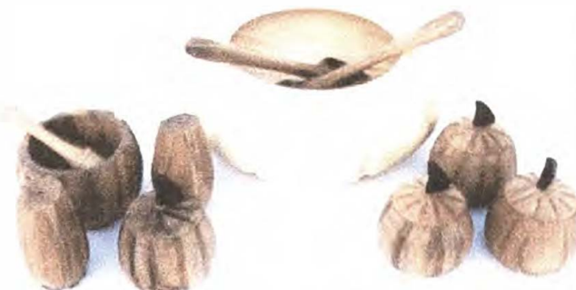
LENSA DE MESA, CUCHARAS, ENSALADERA, MORTERO, CONTENEDOR DE CONDIMENTOS, CONDIMENTERO.