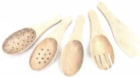
LINEA UTENSILIOS DE COCINA: CUCHARON, ENSALADERA, ESCURRIDOR, ESPÁTULA.