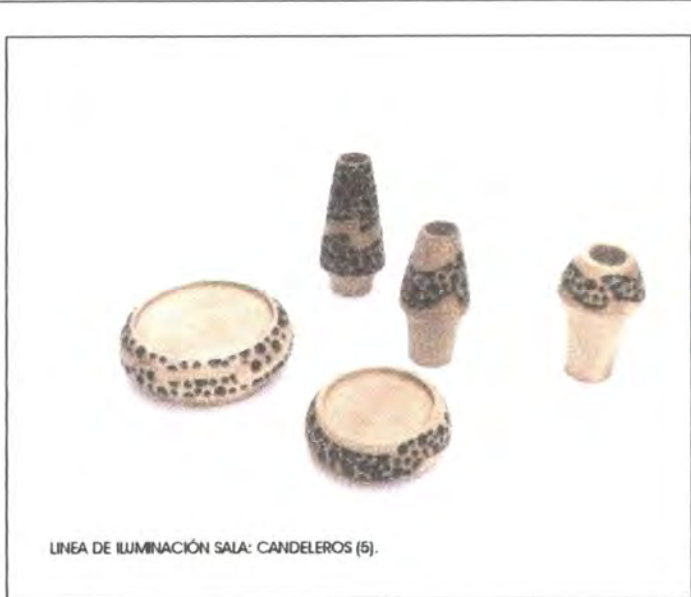
LINEA DE ILUMINACIÓN SALA: CANDELEROS (5).