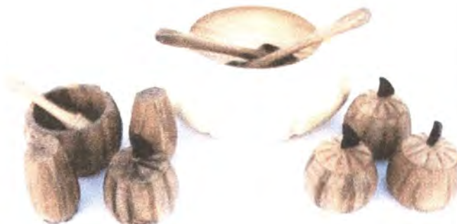
LINEA DE MESA: CUCHARAS, ENSALADERA, MORTERO, CONTENEDOR DE CONDIMENTOS, CONDIMENTERO.