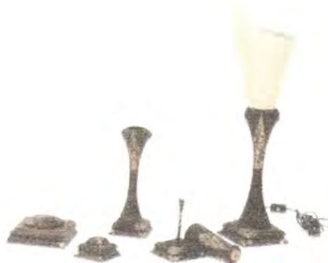
LINEA DE ALCOBA: CANDELERO, PORTA CADENAS, PORTA ANILLOS, COFRE, LAMPARA.