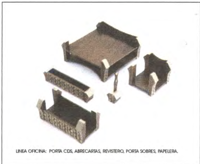
LINEA OFICINA: PORTA CDS, ABRE CARTAS, REVISTERO, PORTA SOBRES, PAPELERA.