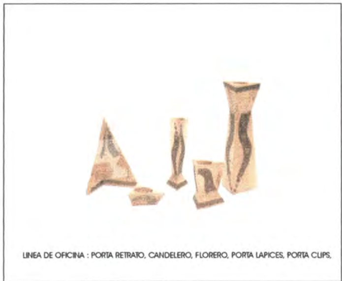
LINEA DE OFICINA : PORTA RETRATO, CANDELERO, FLORERO, PORTA LAPICES, PORTA CLIPS.