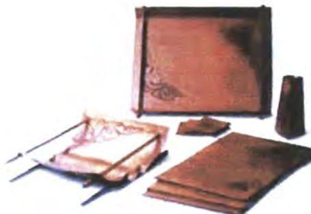
LINEA COMEDOR:FRUTERO, BANDELAS, INDIVIDUALES Y CANDELERO.