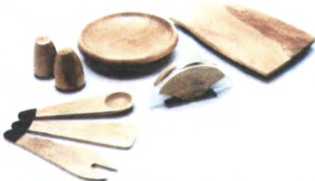
LINEA COCINA: FRUTERO, TABLA PARA PICAR, SERVILLETERO, CONDIMENTEROS Y CUBIERTOS