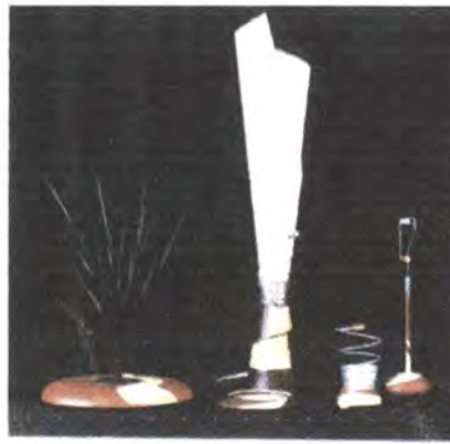
LINEA DE OFICINA: PORTA RETRATO, REVISTERO, PORTA LAPICES, LAMPARA.