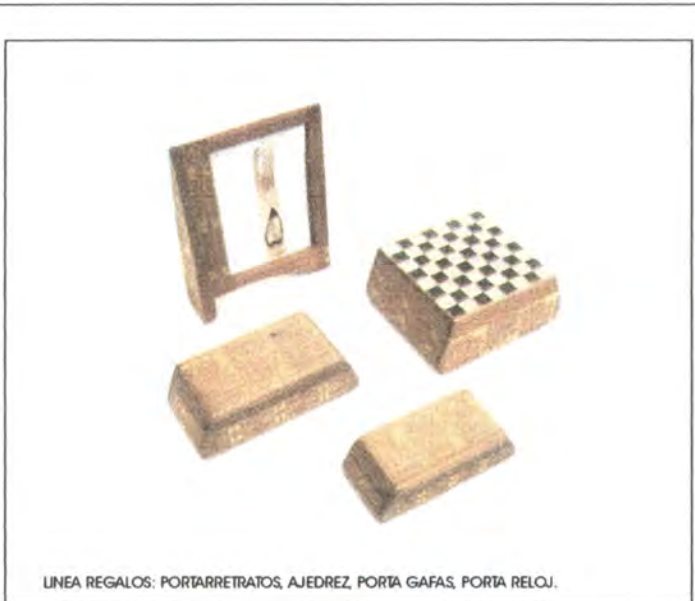
LINEA REGALOS: PORTARRETRATOS, AJEDREZ, PORTA GAFAS, PORTA RELOJ.