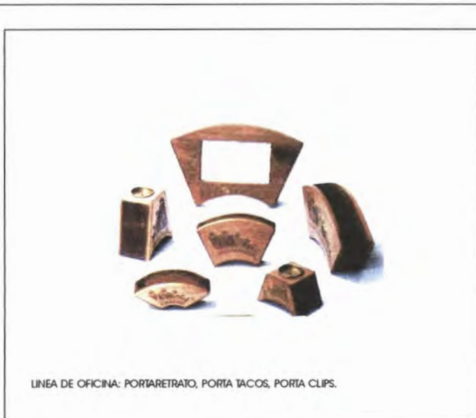
LINEA DE OFICINA: PORTARETRATO, PORTA TACOS, PORTA CLIPS.