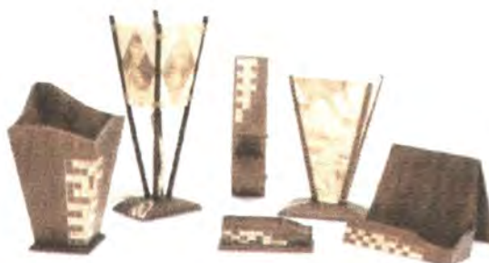
LINEA DE ALCOBA: CONTENEDOR DE OBJETOS PERSONALES, CANECA, PERCHERO, REVISTERO, LAMPARAS (2).