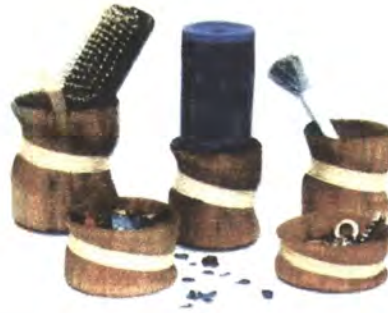
LINEA ALCOBA: CONTENEDORES, CANDELABRO