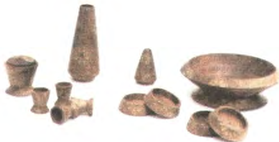
LINEA COMEDOR: ANILLO SERVILLETERO, FLORERO, FRUTERO, AZUCARERA, SALERO, PORTA VASOS.