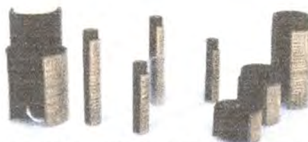
LINEA DE TOCADOR: LAMPARA DE MESA, CANDELABRO GRANDE, CANDELABRO PEQUEÑO, PORTA RETRATOS, COFRE.