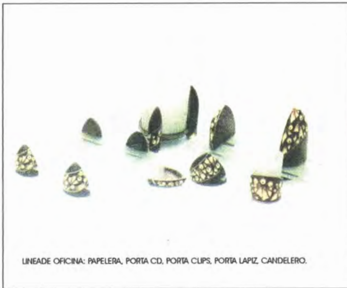
LINEA DE OFICINA: PAPELERA, PORTA CD, PORTA CLIPS, PORTA LAPIZ, CANDELERO.