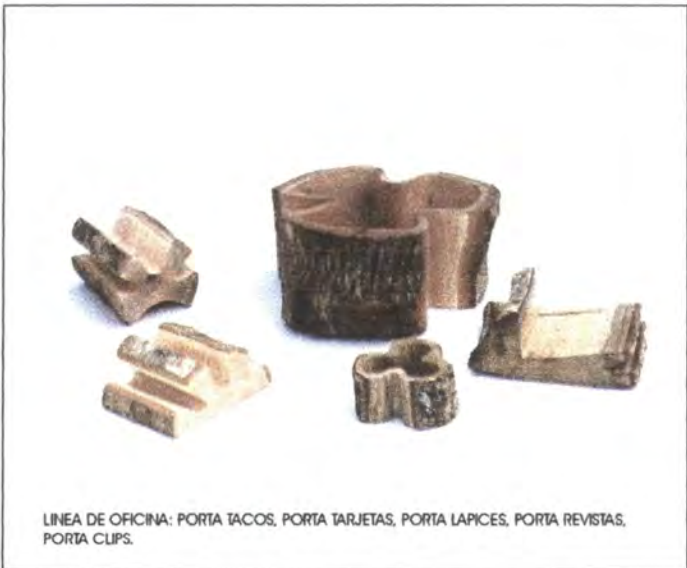
LINEA DE OFICINA: PORTA TACOS, PORTA TARJETAS, PORTA LAPICES, PORTA REVISTAS, PORTA CLIPS.