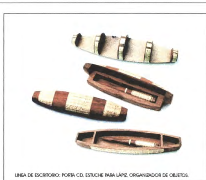
LINEA DE ESCRITORIO: PORTA CD, ESTUCHE PARA LÁPIZ, ORGANIZADOR DE OBJETOS.