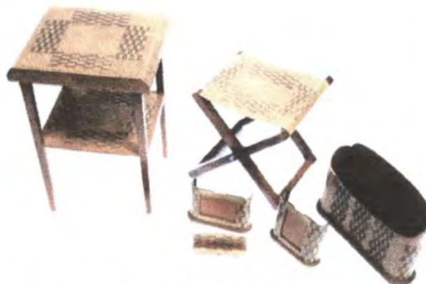
LINEA DE OFICINA: PORTA RETRATOS, PORTA LLAVES, MESA, PORTA PERIÓDICOS, PORTA RECIBOS, BANCO.