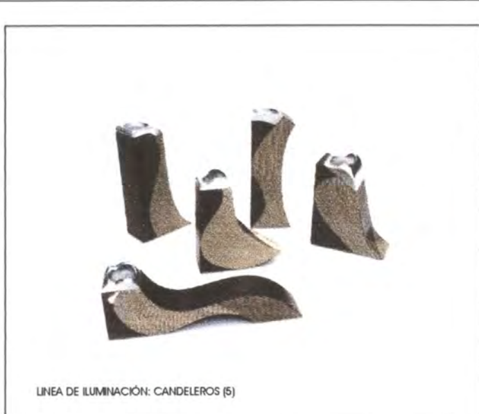
LINEA DE ILUMINACIÓN: CANDELEROS (5)