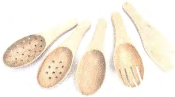
LINEA UTENSILIOS DE COCINA: CUCHARON, ENSALADERA, ESCURRIDOR, ESPÁTULA.