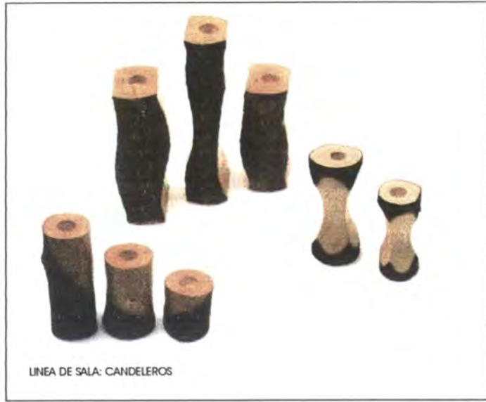
LINEA DE SALA: CANDELEROS