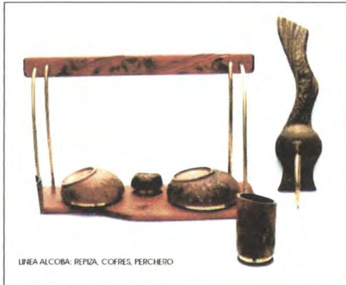
LINEA ALCOBA: REPIZA, COFRES, PERCHERO