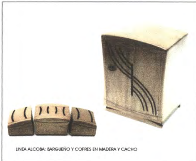
LINEA ALCOBA: BARGUEÑO Y COFRES EN MADERA Y CACHO