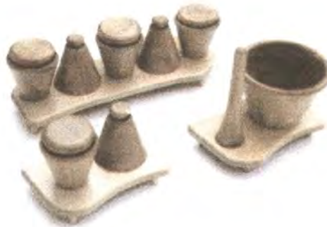
LINEA COCINA: SAL & PIMIENTA, MORTERO, CONDIMENTERO.