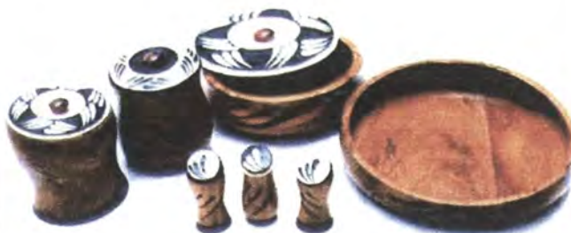
LINEA COCINA: CONTENEDORES DE GRANOS, PANERA, FRUTERO Y CONDIMENTEROS.