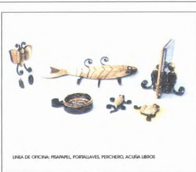
LINEA DE OFICINA: PISAPAPEL, PORTALLAVES, PERCHERO, ACUÑA LIBROS