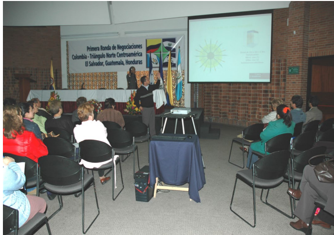
Seminario de exhibición.