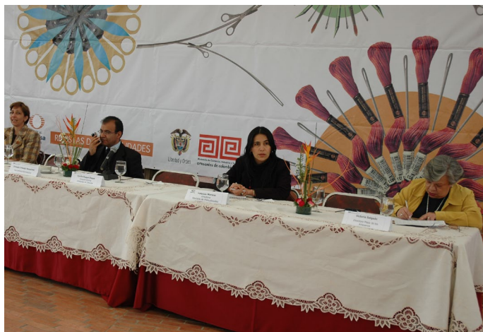
Rueda de prensa.